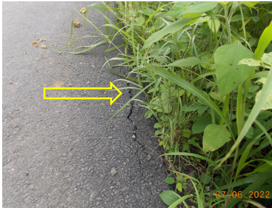
Figura 9: Grietas longitudinales de borde en zona afectada por cárcava en estacionamiento 0+042