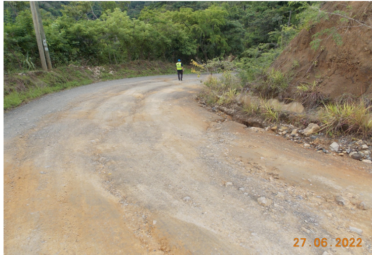
Figura 5: Daños en la superficie de ruedo a causa de los flujos de agua de escorrentía.