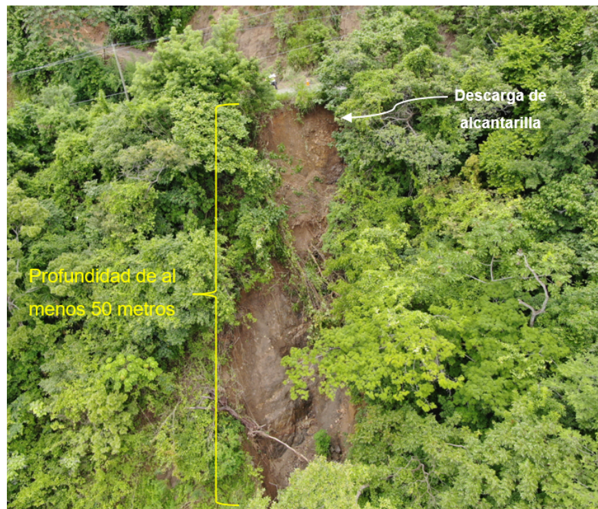
Figura 7: Cárcava formada en ladera en estacionamiento 0+042 por descarga de agua de alcantarilla