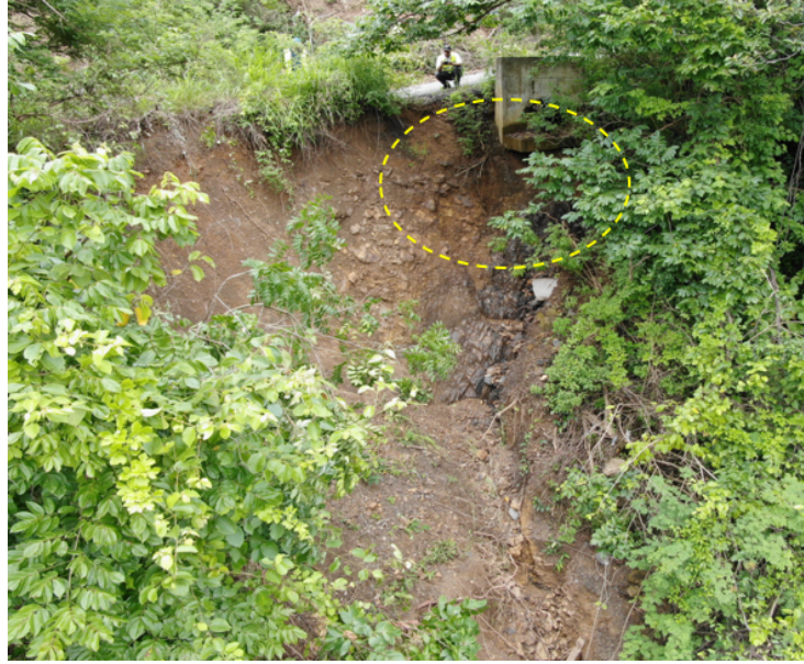
Figura 8: Socavación de estructura de salida de la alcantarilla