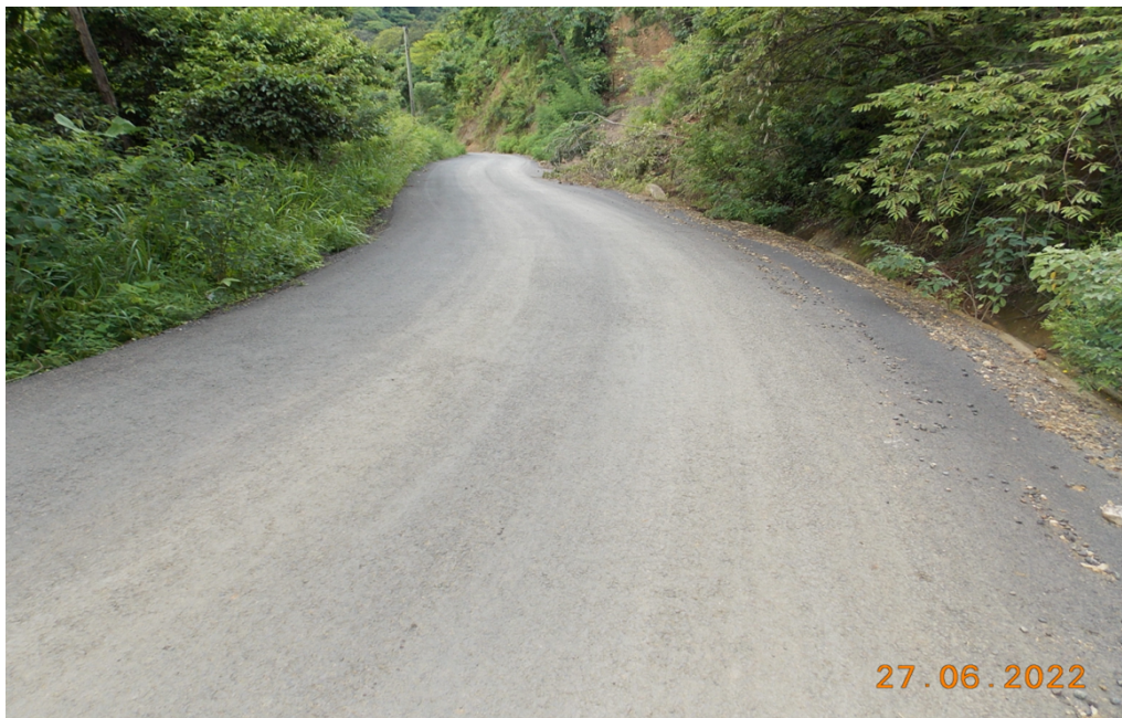
Figura 2: Vista general de vía afectada