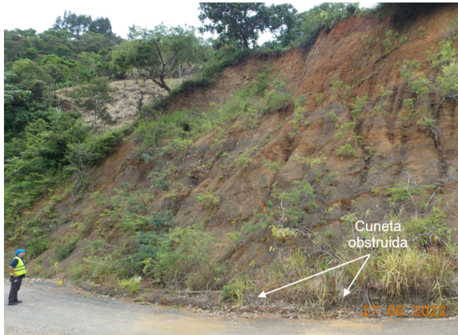
Figura 4: Deslizamiento en estacionamiento 0+023 con afectación de cuneta

Este deslizamiento tiene una longitud aproximada de 30 metros, una altura de 17 metros y se ubica cerca de la intersección con la vía que da acceso a la zona de Linda Vista, al momento de la inspección el material desprendido obstruía la cuneta, por lo que las aguas de escorrentía provenientes del acceso recorren la calzada generando daños en el pavimento y deformaciones (ver figuras 4 y 5). La vista aérea del deslizamiento muestra que en la parte alta del talud hay poca vegetación y no hay contracunetas que eviten que las aguas bajen con velocidad directamente hacia la cara del talud (ver figura 6), por lo que de no realizarse ninguna obra de manejo de aguas es posible que el material siga desprendiéndose como consecuencia de la erosión. Se recomienda realizar obras de manejo de aguas en la parte alta del talud, considerar la aplicación de una protección en la cara del talud para evitar mayor erosión y realizar una limpieza de la cuneta (posiblemente haya que reconstruir algunas secciones). Posterior a estas obras se podría realizar una reparación de la superficie de ruedo.