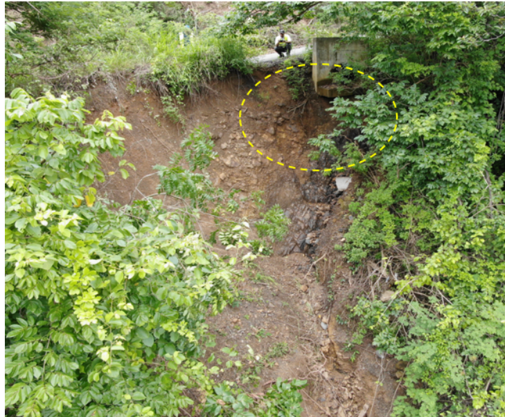
Figura 8: Socavación de estructura de salida de la alcantarilla