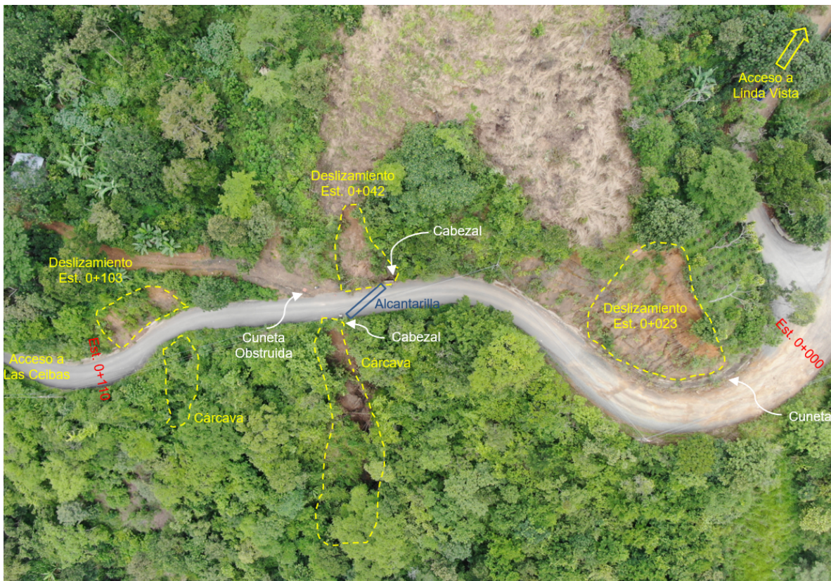
Figura 3: Vista aérea de zona afectada incluyendo varios deslizamiento y cárcavas

En el tramo inspeccionado se identificaron varias zonas con deslizamientos en los taludes, si bien la mayor afectación es la causada por la cárcava que se ha formado en la salida de una alcantarilla que descarga aguas desde la cuneta hacia la ladera lateral que ha generado afectación de las viviendas ubicadas al pie de esta ladera. En la figura 3 se muestra la ubicación de estos deslizamientos. A continuación, se detallará cada uno de estos deslizamientos tomando como punto de referencia inicial la intersección con la ruta que da acceso a Linda Vista.