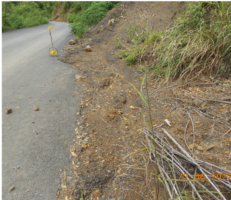
Figura 11: Obstrucción en cuneta por construcción de acceso a propiedad colindante