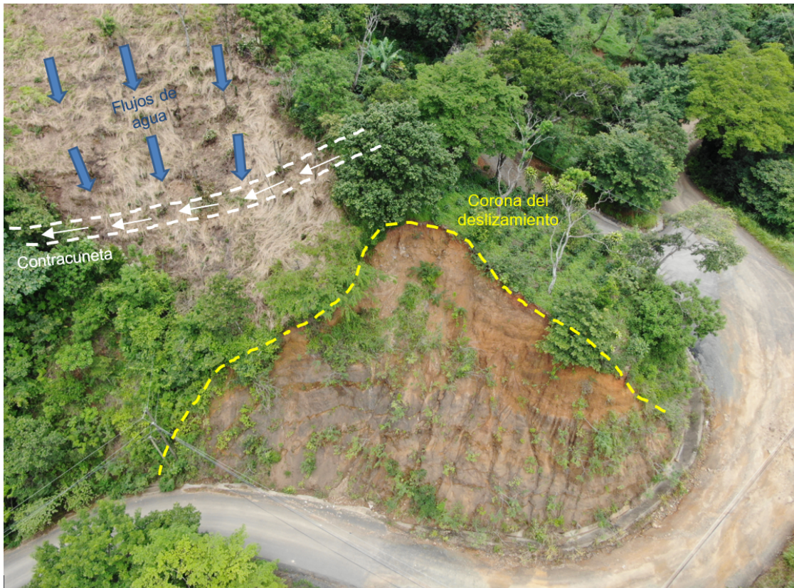
Figura 6: Condición de desprendimiento en estacionamiento 0+023