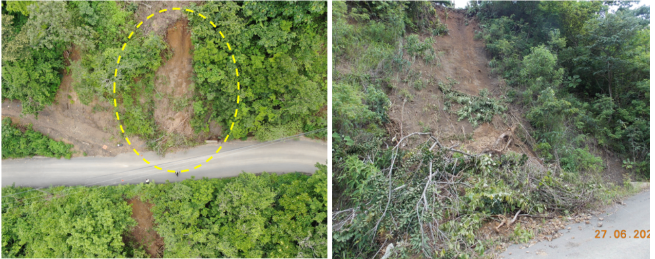
Figura 10: Deslizamiento obstruye parte de la cuneta y envía aguas hacia la cárcava