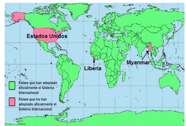
Figura 1. Uso del Sistema Internacional de Unidades alrededor del mundo

en casi todo el mundo. Estas organizaciones son: la Conferencia General de Pesos y Medidas (CGPM), el Comité Internacional de Pesos y Medidas (CIPM) y la Oficina Internacional de Pesos y Medidas (BIPM, por sus siglas en francés). (BIPM, 2014).