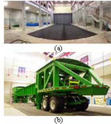
Figura 1.- (a) Instalaciones del PAVELAB y (b) equipo para ensayo de pavimentos a escala real del LanammeUCR, HVS Mark VI (Dynatest)

La definición de la línea de investigaciones en la generación de la CR-ME ha venido gestándose en el LanammeUCR desde el 2010, previo a la compra del Simulador de Vehículos Pesados (HVS, siglas en inglés); posteriormente, en el 2011 se construye el edificio que albergará el PAVELAB (nombre asignado al proyecto de ensayos acelerados). Un año más tarde, en el 2012, se consolida el plan de investigaciones del PAVELAB con la llegada del HVS a Costa Rica (Figura 1); siendo en el 2013 cuando define la sublínea de investigación en Generación de Software, partiendo de la realización de los primeros esfuerzos en el desarrollo de la herramienta de cálculo para el diseño de pavimentos flexibles.