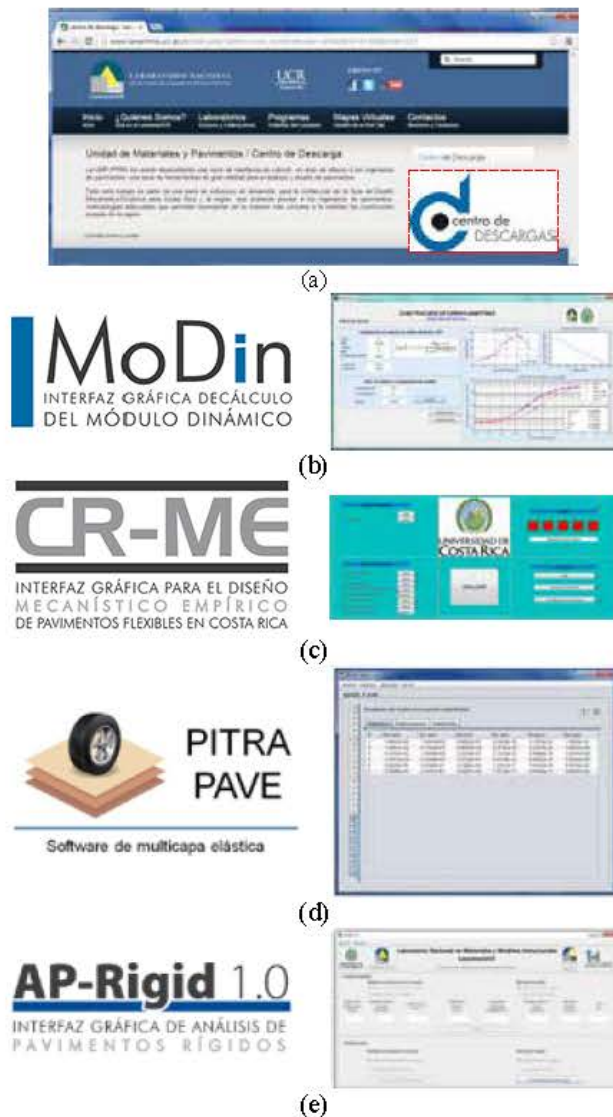
Figura 3.- Sublínea en generación de software (a) Centro de descargas, (b) IMoDin, (c) PITRA-ME v1.0 (d) PITRA-PAVE y (e) AP-Rigid (Leiva, 2013; Vargas, 2013; Trejos, 2014)

para la generación de curvas maestras de módulo dinámico), PITRA-PAVE (herramienta basada en la solución del LanammeUCR para la resolución de la teoría de multicapa elástica), la primera versión del PITRA-ME (herramienta de cálculo que acompaña a la CR-ME en su versión 1.0) y el AP-Rigid (herramienta de cálculo para la determinación de las respuestas mecánicas críticas en pavimentos rígidos e inicio en su incorporación a la CR-ME) (Figura 3).