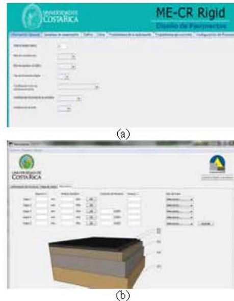
Figura 4.- Sublínea en generación de software (a) Pavimentos de Concreto, (b) Rehabilitaciones

generación de una herramienta mucho más versátil a las actuales y que permita el retrocálculo de módulos con base en la solución multicapa del LanammeUCR (PITRA-PAVE).