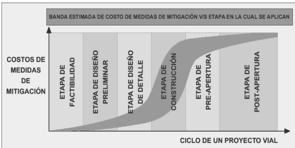
Figura 3. Estimación de costos de una intervención de auditoría según la etapa.

Cuando una auditoría se integra al proyecto desde sus fases tempranas se tienen mayor posibilidad de obtener una carretera altamente segura y por lo tanto menos posibilidad de incidencia de accidentes, de esta forma se colabora a reducir facturas de alto costo y dolorosas para la sociedad.