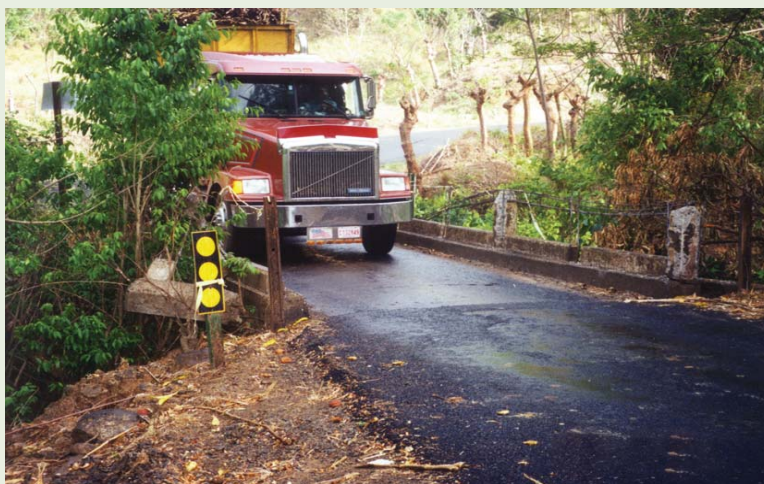
Fotografía 2. El plan vial requiere una visión de largo plazo

-La ubicación y diámetro de las alcantarillas,