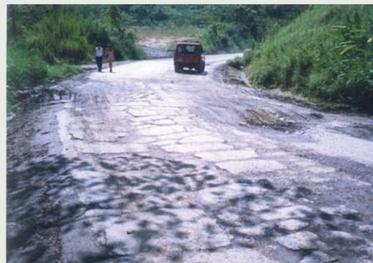
Fotografía 3. Patrimonio vial severamente deteriorado

Más aún, resulta de máximo interés para el país hacer que este tipo de modelos de gestión sean de aplicación obligatoria para cualquier institución pública que administre algún sistema de infraestructura (vías, agua potable, aguas servidas, alcantarillado pluvial, servicios eléctricos, etc). El grado de desarrollo que alcanzará el país, si así se hace la gestión pública, permitirá un salto importante en el desarrollo y calidad de vida de la población.