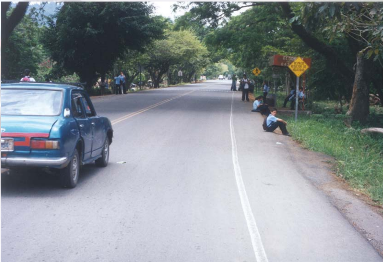
Fotografía 2. Conflicto entre usuarios de las vías (vehículos y peatones), con el consecuente riesgo de accidentes

- Construcción de obra nueva. En este caso la inversión está destinada a construir un camino o una carretera nueva. Estos proyectos se hacen en función de los planes futuros de ampliación de la red vial, de acuerdo con la demanda futura de transporte (carga y pasajeros).