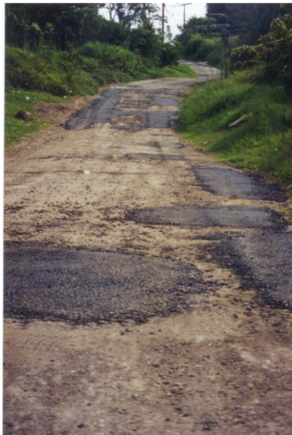
Fotografía 1. Intervenciones inapropiadas de mantenimiento

Estos indicadores miden de forma objetiva y con transparencia, la calidad y la eficiencia en el uso de los fondos públicos. Además permiten conocer realmente el desarrollo histórico del sistema vial.