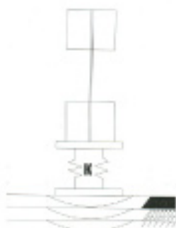
Esquema de aplicación de carga del Deflectómetro de Impacto.