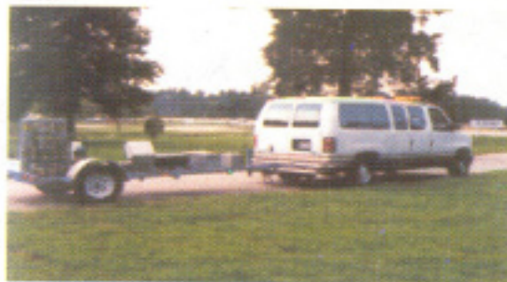
Deflectómetro de Impacto (FWD)