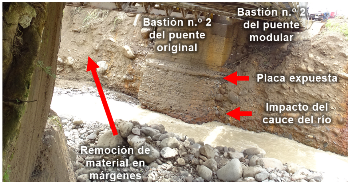
Figura n.º 2. Remoción de material frente a bastión n.º 2 de puente original y márgenes.