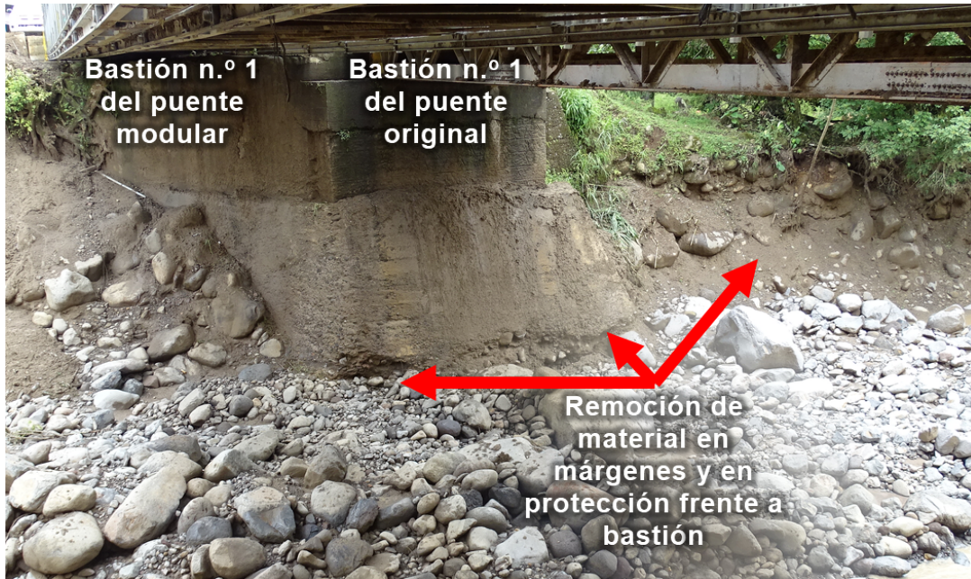
Figura n.º 3. Remoción de material debajo de protección contra la socavación de bastión n.º 1 de puente original y márgenes.