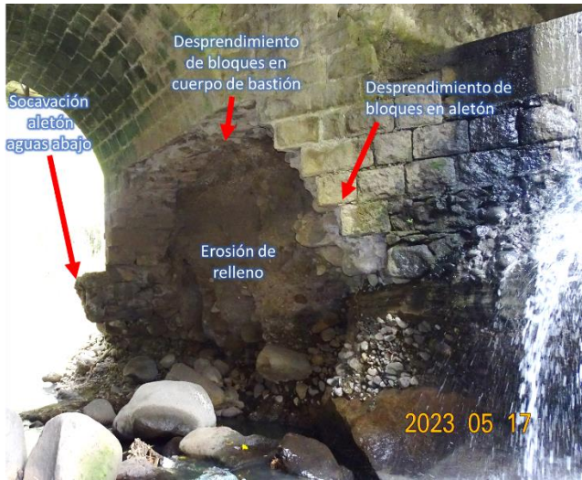
(a) Socavación en bastión n.º 1