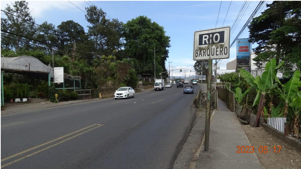
Figura 4.2. Vista a lo largo de la línea de centro del puente hacia Paraiso