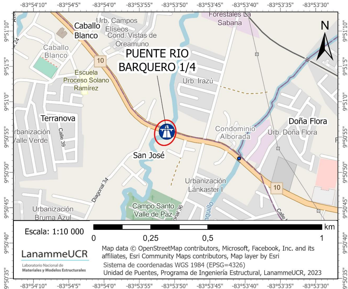
Figura 4.1. Ubicación geográfica del puente