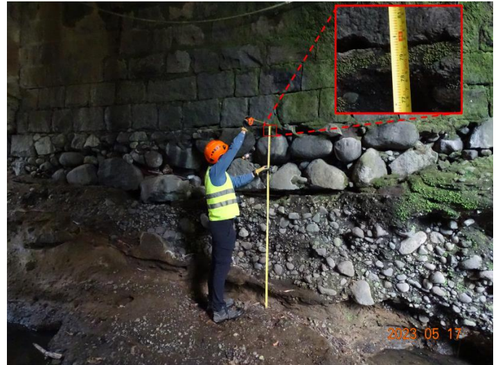
(b) Socavación en bastión n.º 2