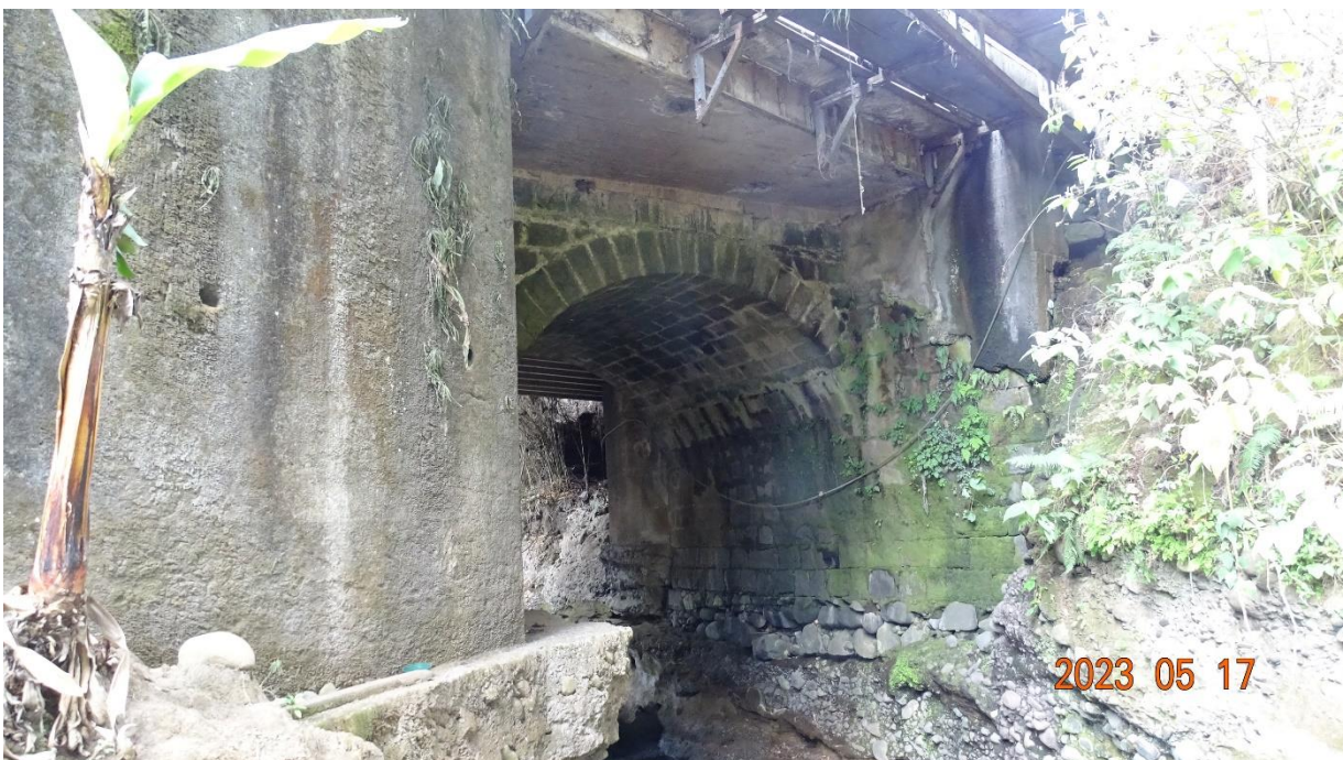
Figura 4.3. Vista lateral del costado aguas abajo del puente