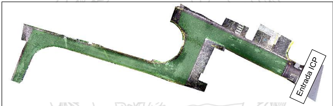
Figura 5. Área a colocar una sobre capa