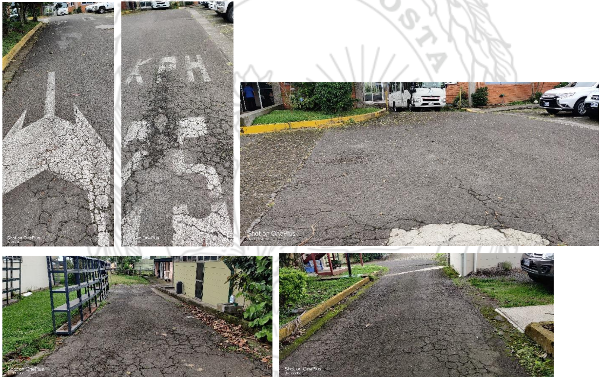
Figura 1. Deterioro piel de lagarto

Para el caso de análisis, se pudo observar que este tipo de deterioro estaba presente en la mayoría de la superficie de ruedo, abarcando cerca del 60% del área inspeccionada a todo lo ancho de la calzada, como se muestra en la Figura 1.