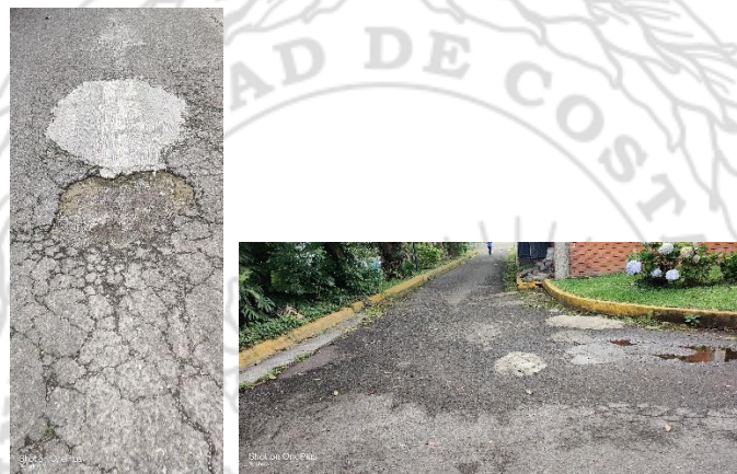
Figura 2. Deterioro tipo Bache

Se detectó la presencia de baches realizados, en apariencia con concreto hidráulico, siendo una práctica inadecuada, puesto que el material reemplazado debió ser del mismo tipo para reparar un problema presente en el pavimento asfáltico existente, ya que genera incompatibilidad para darle homogeneidad y continuidad al comportamiento propio de tipo de pavimento que se sustituyó, tal y como se muestra en la Figura 2.