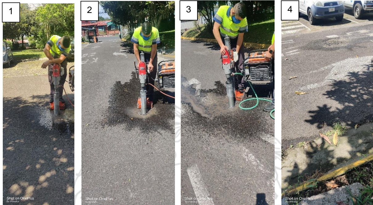
Figura 3. Ubicación de la extracción de núcleos

Como resultado de esta extracción de núcleos se obtuvo los siguientes espesores: