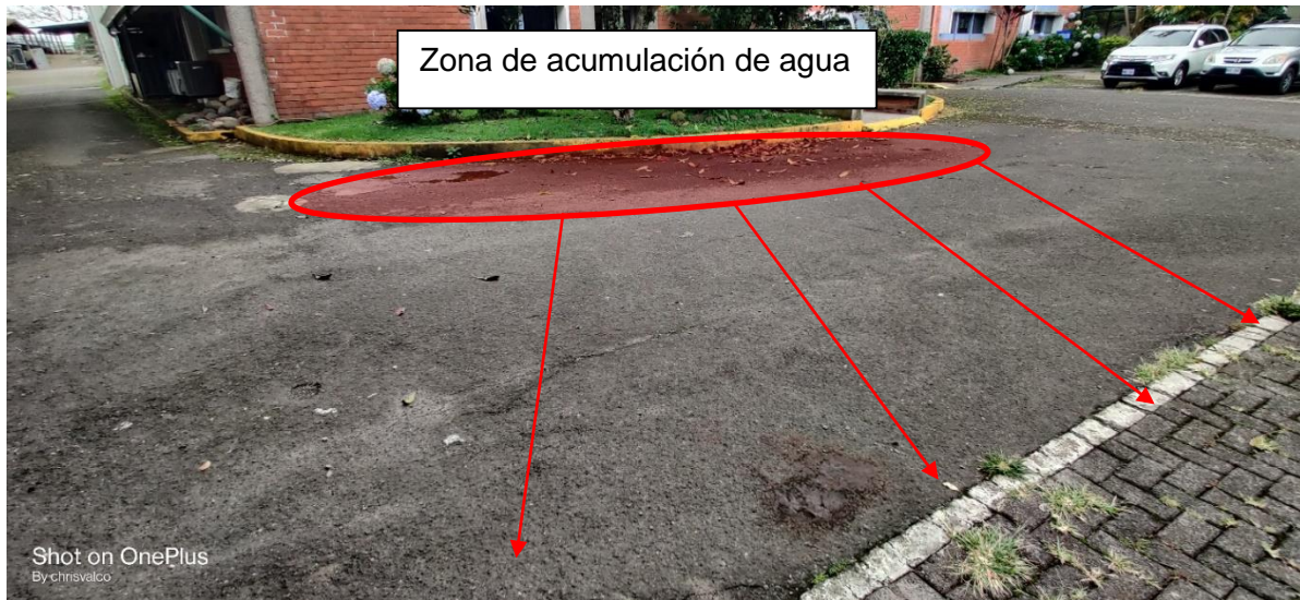
Figura 6. Zona recomendada con desnivel.