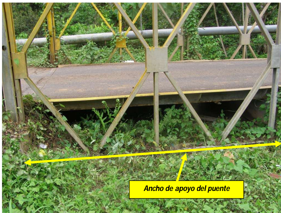
Figura 14. Apoyo de la armadura del puente directamente sobre el terreno