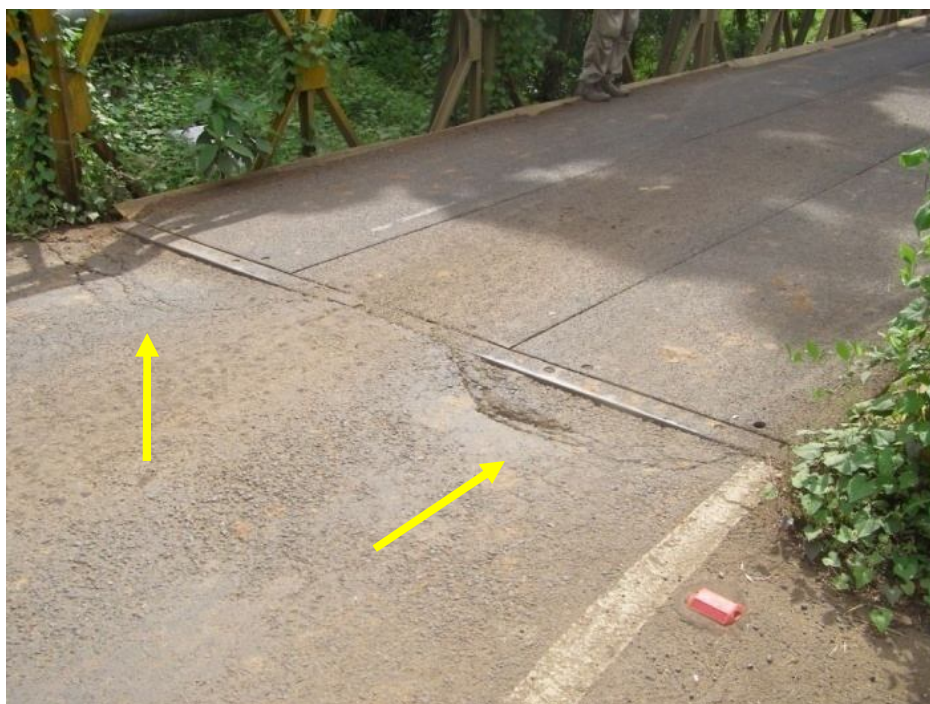
Figura 7. Asentamiento del acceso al puente.