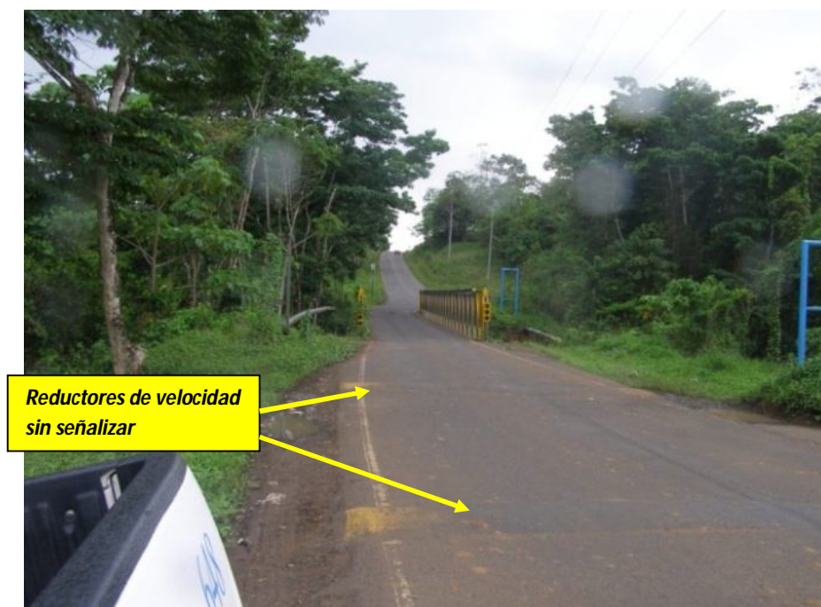
Figura 4. Los accesos no cuentan con guardavías ni reductores de velocidad debidamente señalizados