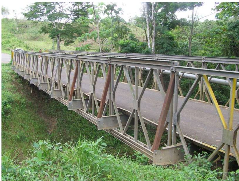
Figura 3. Vista lateral del puente modular

El puente no cuenta con algún tipo de bastión o estructura que sirva de apoyo a su superestructura. Esta mas bien se apoya directamente sobre una terraza con un ancho de apoyo de aproximadamente 3.0m.