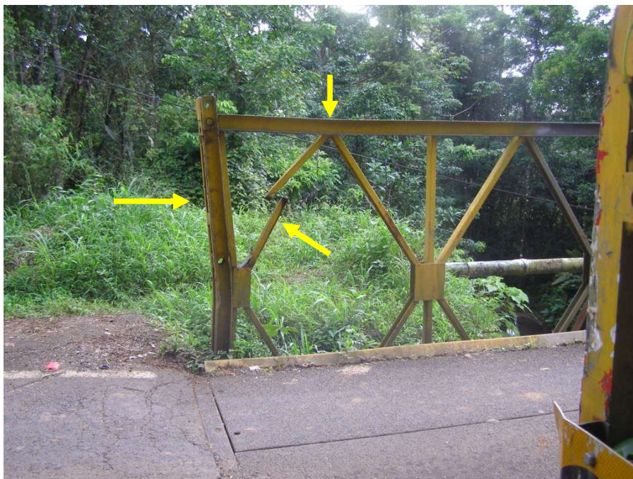
Figura 9. Elemento diagonal cortado, elemento vertical y cuerda superior deformados debido a una colisión.