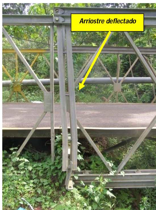
Figura 13. Arriostre diagonal deformado