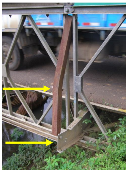
Figura 11. Viga transversal y arrioste diagonal deformados