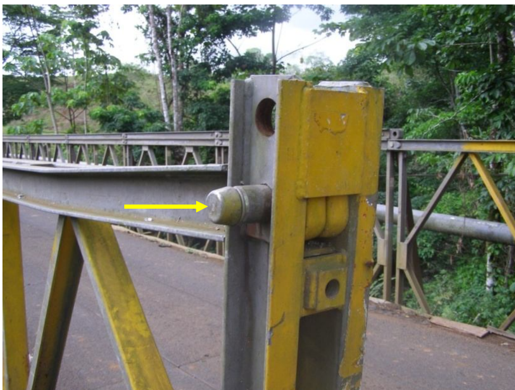
Figura 10. Pin para conexión de la cuerda superior está a punto de deslizarse fuera de su posición normal.