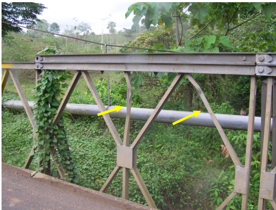
Figura 8. Elementos diagonales y verticales deformados.