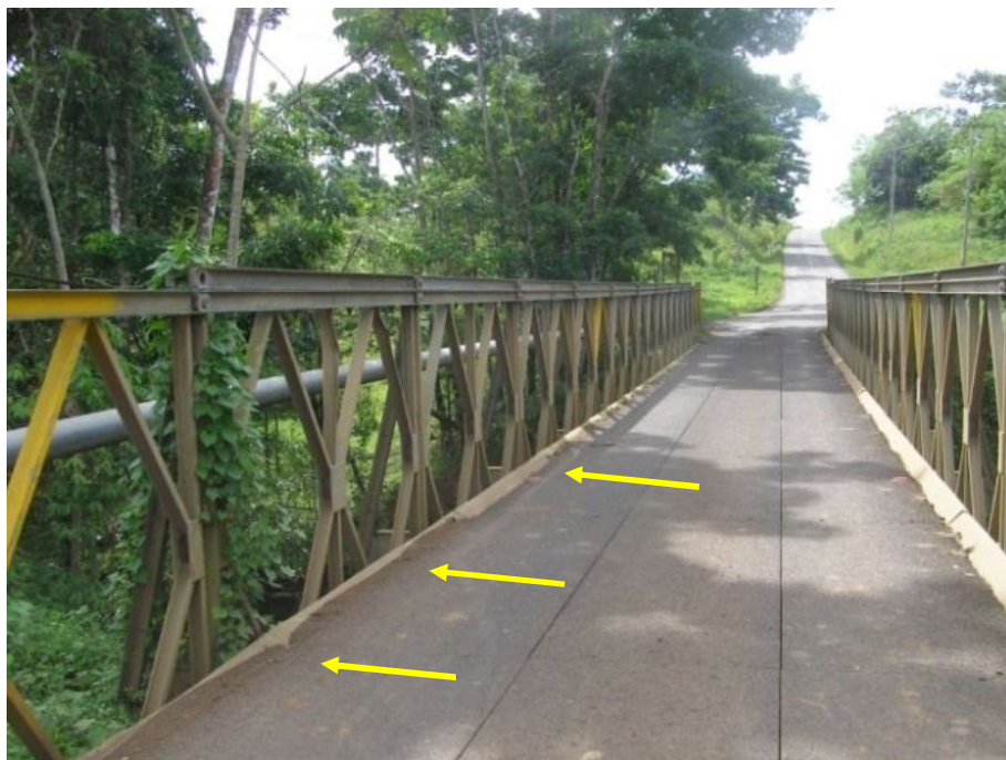
Figura 5. Acumulación de sedimento en las cunetas