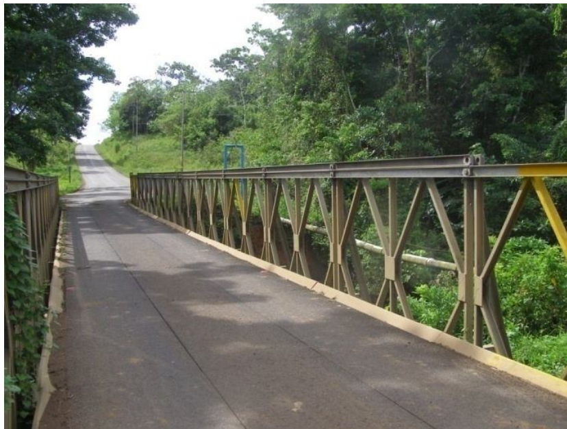
Figura 2. Vista general del puente modular.

El puente es una estructura modular MABEY con una longitud total de aproximadamente 33.0m y un ancho total y de calzada 3.30m. El puente consta de un solo carril. (Ver Figura 2)