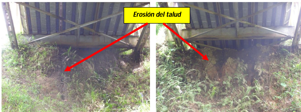
Figura 15. Pérdida de ancho de apoyo del puente por erosión del talud. Apoyo Sur (izq.) y Apoyo Norte.