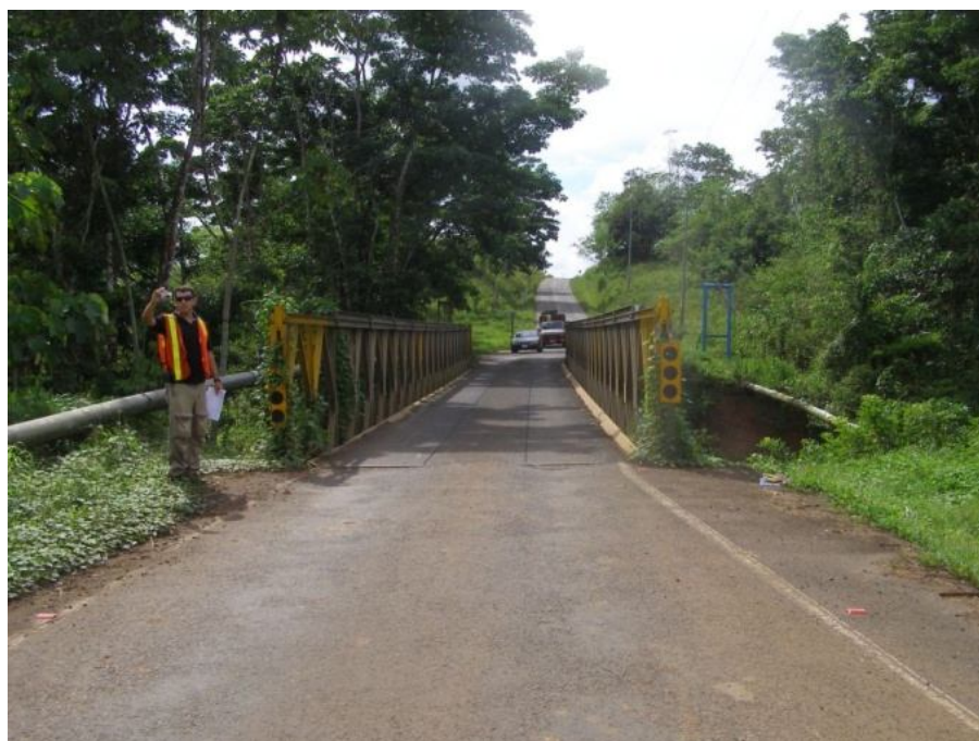
Figura 6. Los accesos no cuentan con un sistema de drenaje.