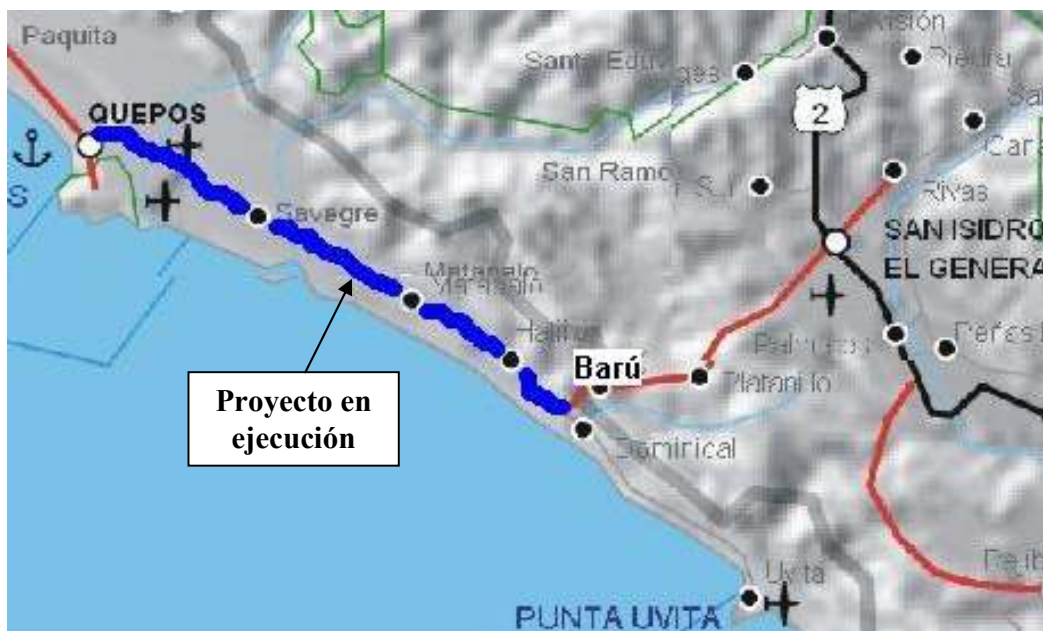
Figura No.1: Ubicación del proyecto

El proyecto fue adjudicado a la empresa Constructora Hernán Solís S.A. y consiste en la construcción de los drenajes y terraplenes de la carretera que se extiende desde Quepos hasta Barú. Consta de dos frentes de obra que dividen el proyecto específicamente desde Quepos, en el Colegio de la localidad, hasta el puente sobre el río Savegre; y desde el puente sobre el río Savegre hasta Barú, donde se interseca la ruta No.34 con la ruta No.243 proveniente de San Isidro del General. La longitud total del proyecto es de 42.1 km aproximadamente.