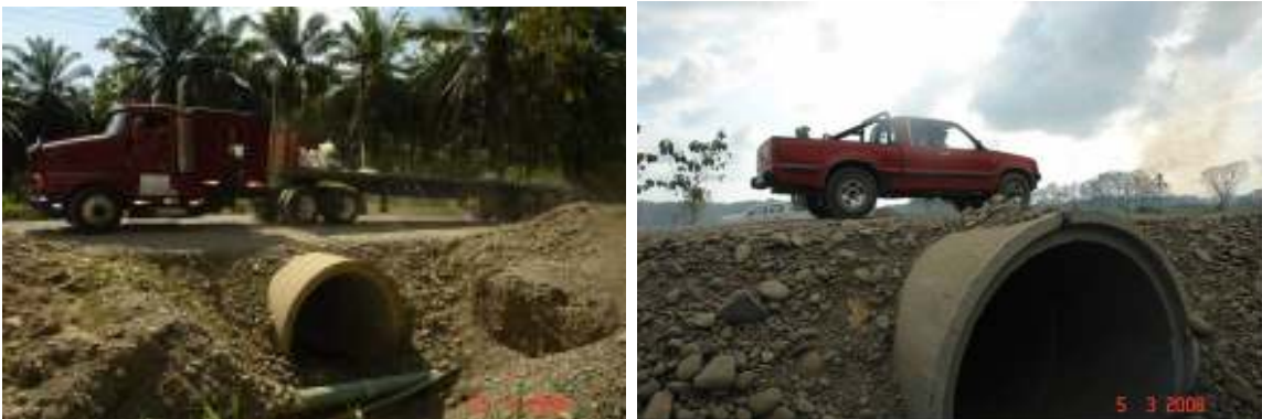
Fotografías No.17 y No.18: Alcantarillas que no cuentan con un relleno de protección suficiente para soportar el paso de tránsito pesado. Estos ejemplos de tubos colocados se ubican en los estacionamientos 32+800 del tramo Quepos-Savegre y el 14+140 del tramo Savegre-Barú. Las fotografías el 24 de enero y el 5 de marzo del 2008.

Por otro lado, al observar por dentro de algunos de estos tubos, se constató la existencia de fisuras en sus paredes internas que podrían afectar el funcionamiento óptimo de los drenajes y la capacidad de soporte de la carretera. Esta situación propicia la ocurrencia de hundimientos en la carretera.