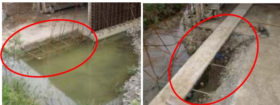
Fotografías No.13 y No.14: Se puede ver que se quedan elementos inconclusos. En este caso, la losa no se concluyó y quedan juntas de construcción que deben tratarse adecuadamente. Además el acero queda expuesto a la intemperie. La alcantarilla se construía en el kilómetro 46 de la sección Quepos - Savegre. La fotografía fue tomada el 20 de noviembre del 2007.

En la visita realizada el 20 de noviembre del año 2007, se notó que algunos elementos que conforman las alcantarillas de cuadro en construcción, no se colaron totalmente, lo cual obligó a terminar de colarlos días después. Esto propicia que se formen juntas que pueden ser perjudiciales para el desempeño de cada elemento en caso que no se traten de manera adecuada. Además, tal y como se comentó con anterioridad, el acero queda expuesto a la intemperie, aumentando las posibilidades de deterioros acelerados de estas obras. Estas reparaciones pueden provocar que los elementos no cuenten con una homogeneidad adecuada entre las propiedades del concreto colocado previamente y el colocado después. Esto induce a la formación de discontinuidades en un mismo elemento que pueden propiciar zonas de alta permeabilidad, con el riesgo eventual de que se infiltren sustancias que puedan corroer el acero de refuerzo o atacar químicamente la pasta del concreto. Esto debilitaría la resistencia de estos elementos y en consecuencia pondría en peligro su durabilidad y desempeño. En las fotografías No.13 y No.14 se nota que queda el acero de refuerzo desprotegido y no se construyen los elementos completamente en una sola colada.