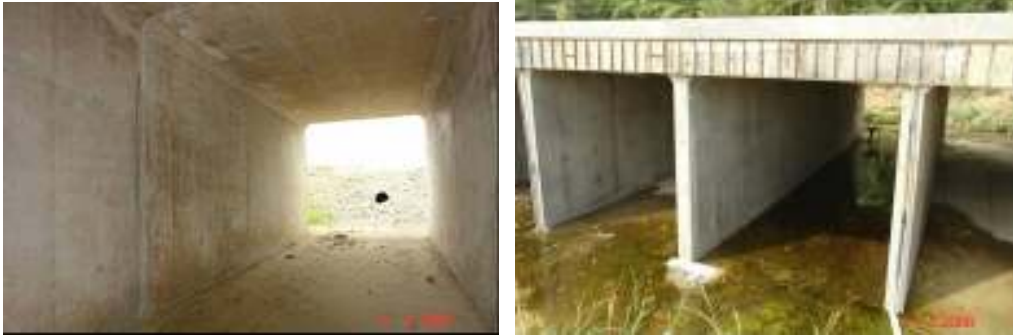
Fotografía No.11 y No.12: Se muestran algunos ejemplos de alcantarillas que se observan sin agrietamientos o porosidad que se deba de reparar. Las fotografías fueron tomadas el día 5 de marzo del año 2008 en la alcantarilla de cuadro ubicada en el estacionamiento 46+230 en el tramo Quepos – Savegre y en el estacionamiento 5+940 en el tramo Savegre- Barú.