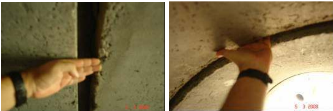
Fotografías No.21 y No.22: Alcantarilla con los empalmes abiertos entre los tubos. Se ubica en el estacionamiento 11+100 del tramo Savegre – Barú. Las fotografías fueron tomadas el 5 de marzo del año 2008.

De acuerdo con las especificaciones del CR-77, en el apartado 603.06 referente a los empalmes de la tubería se cita claramente que: