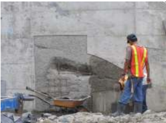
Fotografía No.8: Cuadrillas de trabajo haciendo correcciones en los elementos de la alcantarilla de cuadro ubicada en el estacionamiento 46+860 el día 20 de noviembre del 2007.

Durante la visita realizada por el equipo auditor del LanammeUCR el día 20 de noviembre del 2007, se observaron cuadrillas de trabajadores haciendo reparaciones a las superficies porosas y huecos tal como se muestra en la fotografía No.8. Sin embargo, es importante identificar el origen de estos defectos constructivos para evitar hacer este tipo de reparaciones en el futuro y además determinar a criterio del ingeniero, si es necesario volver a construir el elemento.