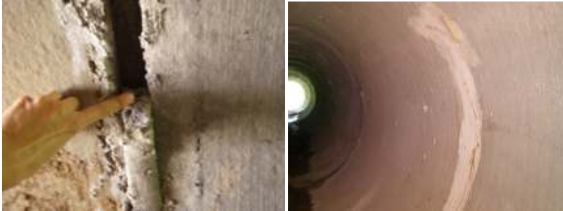
Fotografías No.19 y No.20: Alcantarillas con fisuras y huecos entre tubos que propician la socavación y la filtración del agua. Esta alcantarilla de tubo de 1.20m de diámetro se ubica en el estacionamiento 10+810 del tramo Savegre – Barú. Las fotografías fueron tomadas el 20 de noviembre del año 2007.