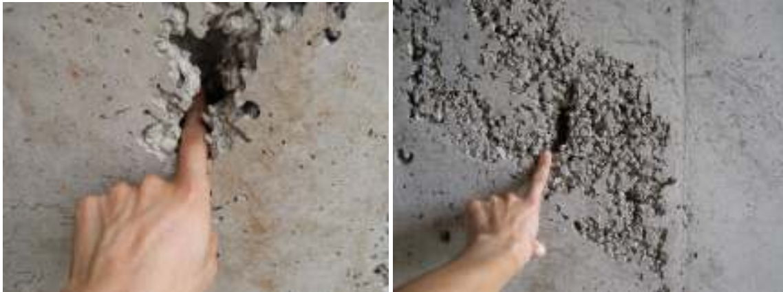
Fotografías No.6 y No.7: Se puede ver las deficiencias constructivas en los elementos de concreto. Esta alcantarilla está ubicada en el estacionamiento 46+730, sección Quepos - Savegre. Fecha: 20 de Noviembre del 2007.

La porosidad del concreto es sin duda un factor crucial en todos estos fenómenos, ya que la penetración será más rápida cuando la porosidad del recubrimiento resulte ser mayor. 2