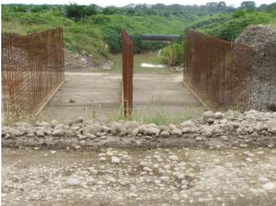
Fotografía No.1: Se puede notar que la armadura se mantiene expuesta a la intemperie y no se protege. Es evidente la corrosión existente. La alcantarilla fue ubicada en el kilómetro 45 de la sección Quepos – Savegre. Fecha: 20 Noviembre del 2007.

En la visita realizada el 20 de noviembre del año 2007, se observó que se colocó la armadura de una alcantarilla de cuadro ubicada en el kilómetro 45 de la sección Quepos - Savegre y quedó expuesta a la intemperie, lo que se evidenció por la corrosión perceptible a simple vista. En el lugar de la obra no se había colocado aún la formaleta para el colado de concreto, por lo cual este acero iba a quedar expuesto un tiempo adicional y sujeto a más corrosión. Se puede observar en la fotografía No.1 la corrosión que posee el acero de refuerzo colocado.