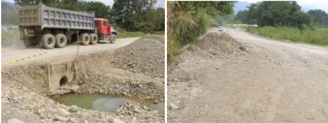
Fotografías No.23 y No.24: Zonas de riesgo para el usuario que no poseen suficiente señalización preventiva. Visita realizada el 20 de noviembre del 2007.