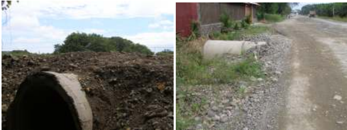
Fotografías No.15 y No.16: Alcantarillas que no cuentan con un relleno de protección suficiente para soportar el paso de tránsito pesado. Estos ejemplos de tubos colocados se ubican en los estacionamientos 10+810 del tramo Savegre - Barú y el estacionamiento 33+143 del tramo Quepos – Savegre. Las fotografías fueron tomadas el 20 de noviembre del 2007.

que este aspecto debe ser altamente considerado. Las fotografías No.15, No.16, No.17 y No.18 muestran algunos ejemplos encontrados.