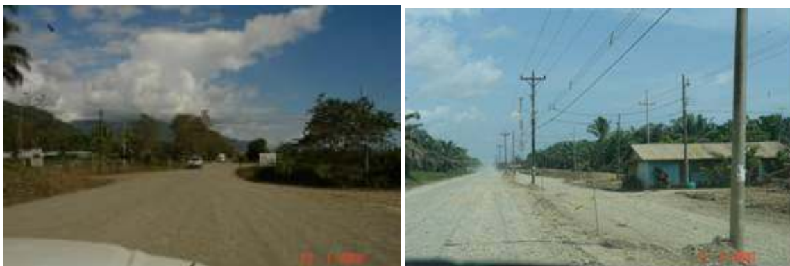
Fotografías No.25 y No.26: Zonas de riesgo para el usuario que no poseen suficiente señalización preventiva. Fotografías tomadas los días 23 de enero y 5 de marzo del 2008.

Nuevamente en este segundo informe de auditoría técnica se determina que se incumple lo estipulado en el Cartel de Licitación, específicamente en lo relacionado a las disposiciones establecidas en el Reglamento de Dispositivos de Seguridad de Protección de Obra, situación que pone en peligro permanente, la integridad física de los usuarios que transitan por la vía y de los trabajadores de la obra, siendo más riesgoso en horas nocturnas ante la falta de señales preventivas.