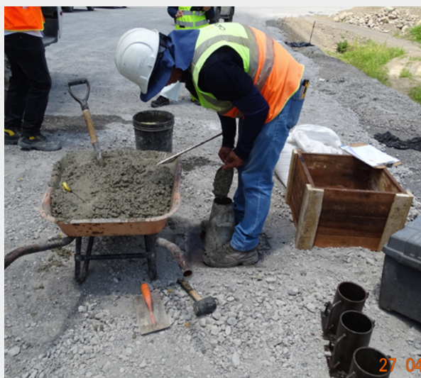
Figura 1. Ejecución del ensayo de asentamiento de concreto recién mezclado.

Proyecto: Rehabilitación y Ampliación Ruta Nacional No.32, Carretera Braulio Carrillo, Sección Intersección Ruta Nacional No. 4-Limón.