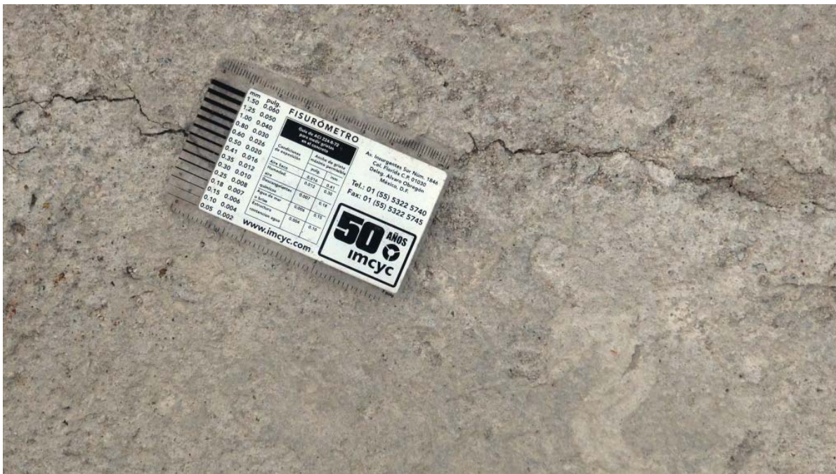
Figura No.16. Intercambio Bagaces - Ejemplo del espesor de fisuras observado (Fisura de 0.5mm)