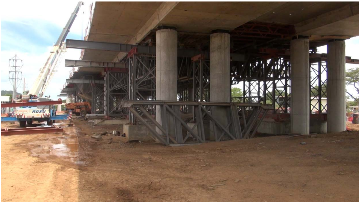
Figura 3: Intercambio Cañas. Vista inferior en el sentido Sur