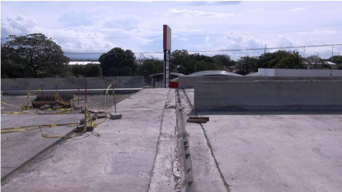
Figura 18: Aun no ha iniciado la instalación de la junta de expansión.