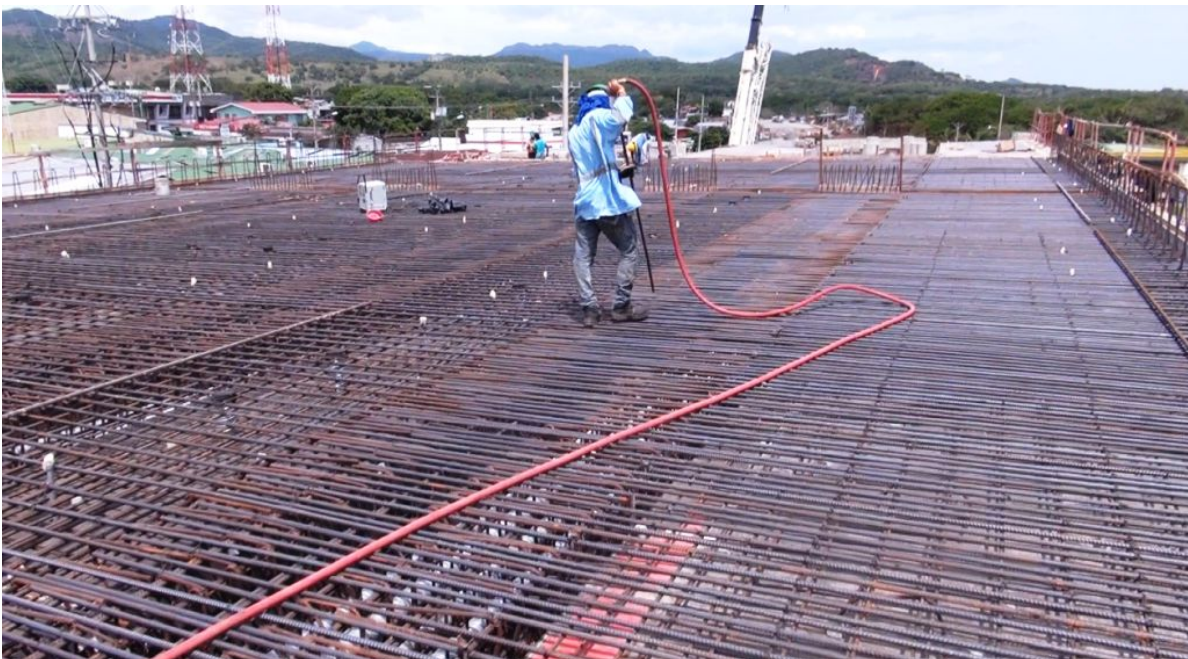
Figura 5: Intercambio Cañas. Preparación para el colado de un segmento de la superestructura.