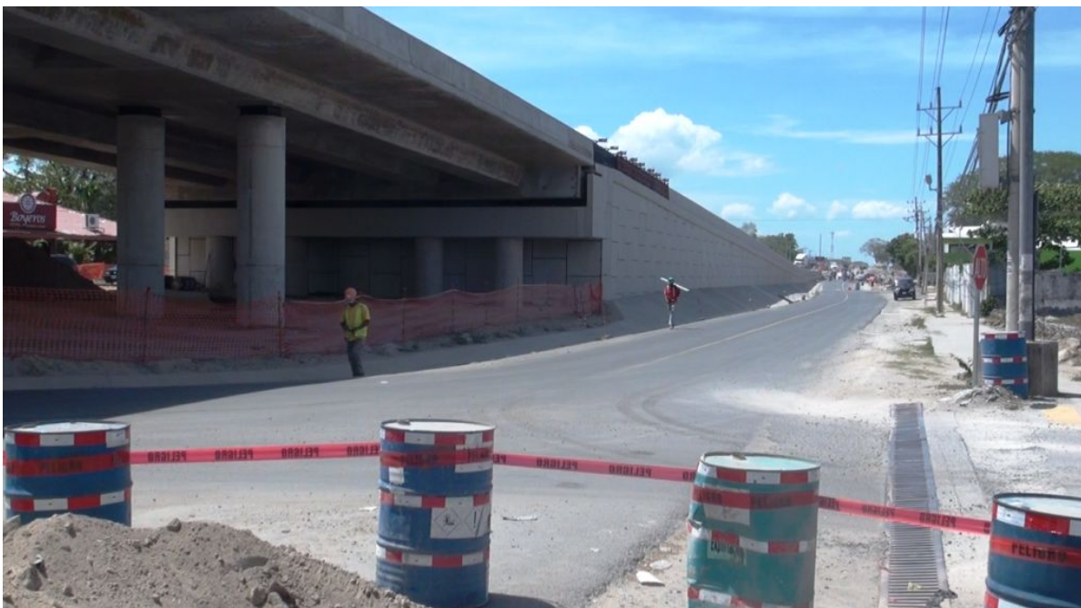
Figura 12: Avance en la construcción del acceso Sur.