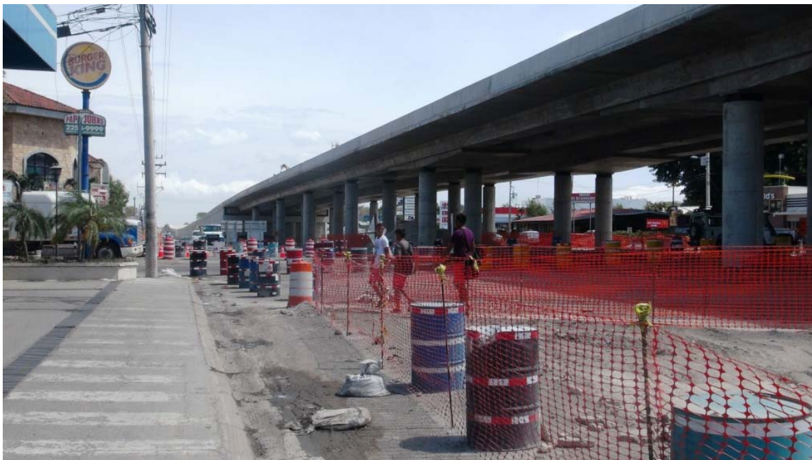
Figura 10: Intercambio Liberia. Ya se completó la construcción de la superestructura