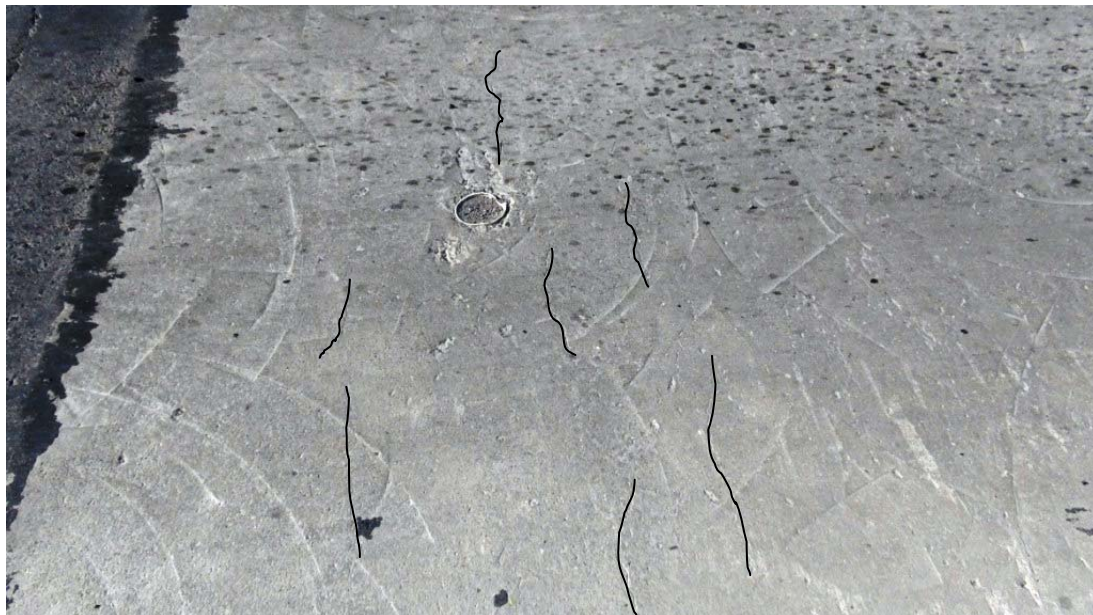
Figura No.14. Intercambio Bagaces - Fisuras observadas en el puente de salida de Bagaces. Puente Este. (Fisuras resaltadas con líneas negras)