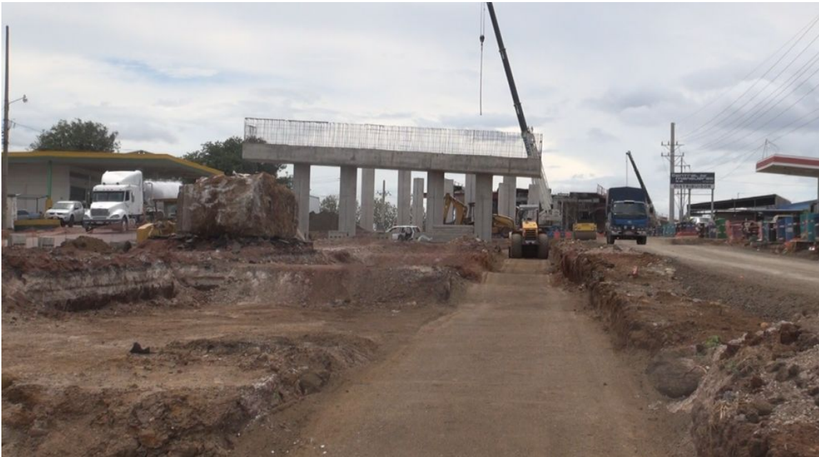
Figura 4: Intercambio Cañas. Progreso en la construcción del acceso-Sur.