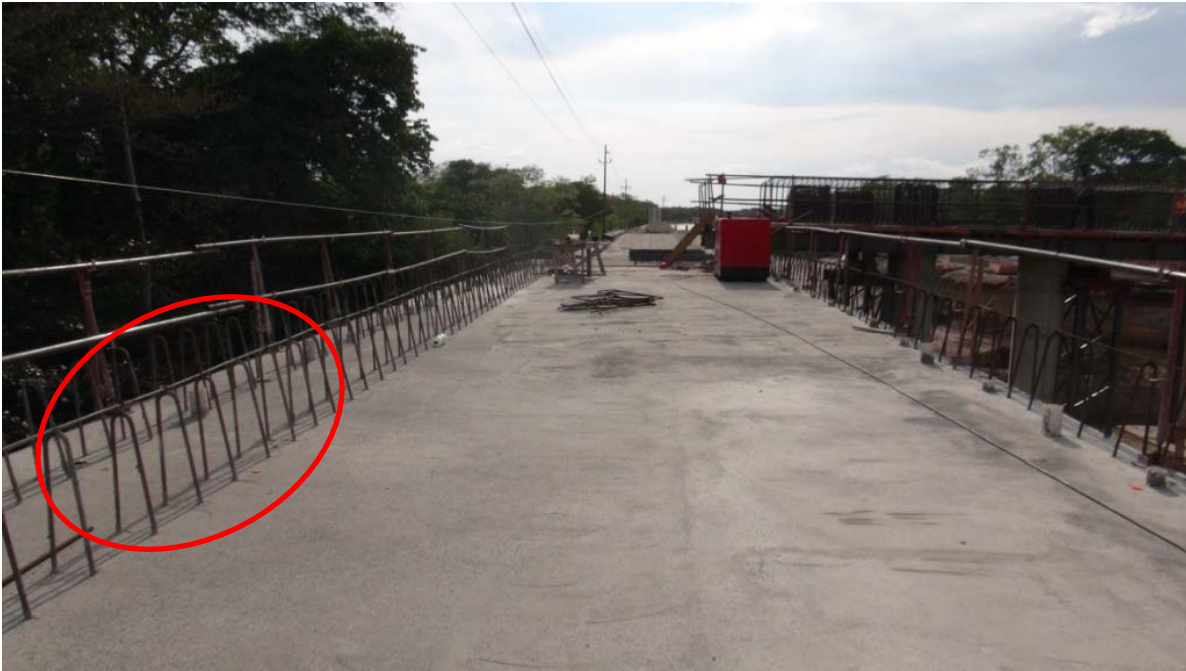
Figura No.13. Intercambio Bagaces - Vista del puente Este donde se observa a la izquierda el acero de refuerzo de dos barreras vehiculares.