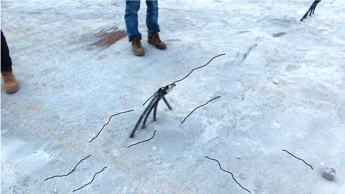
Figura No.15. Intercambio Cañas - Fisuras detectadas en la superficie de las superestructura del puente principal. Extremo Sur (Fisuras resaltadas con líneas negras).