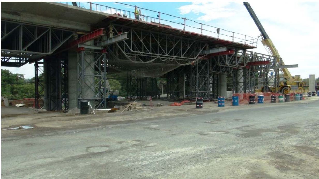
Figura 8: Intercambio Bagaces. Faltan construir la superestructura en los 4 últimos tramos del extremo Norte.