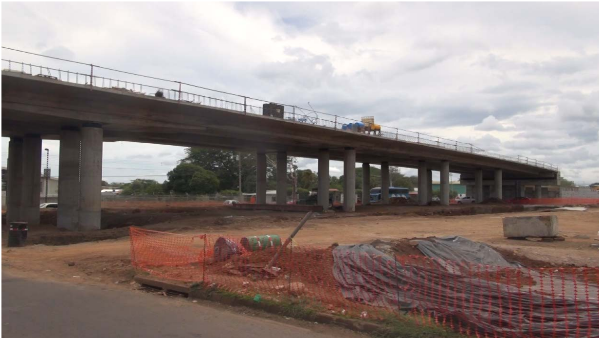
Figura 2: Intercambio Cañas. Vista lateral del extremo Norte