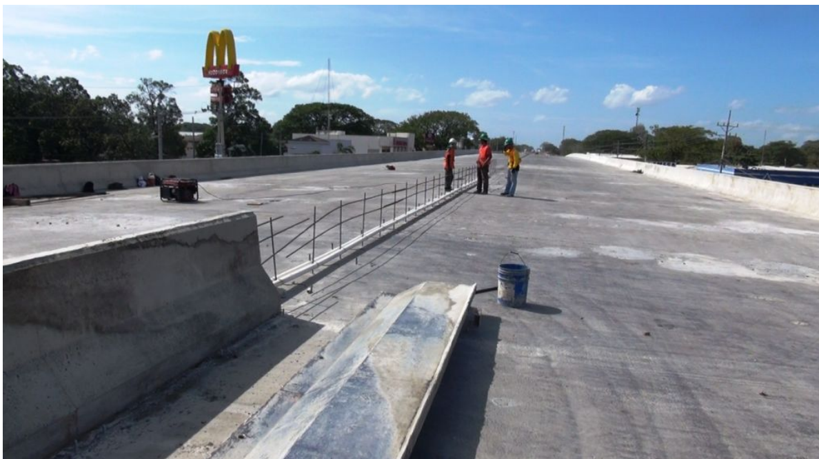
Figura 17: Intercambio Liberia. Construcción de la barrera medianera