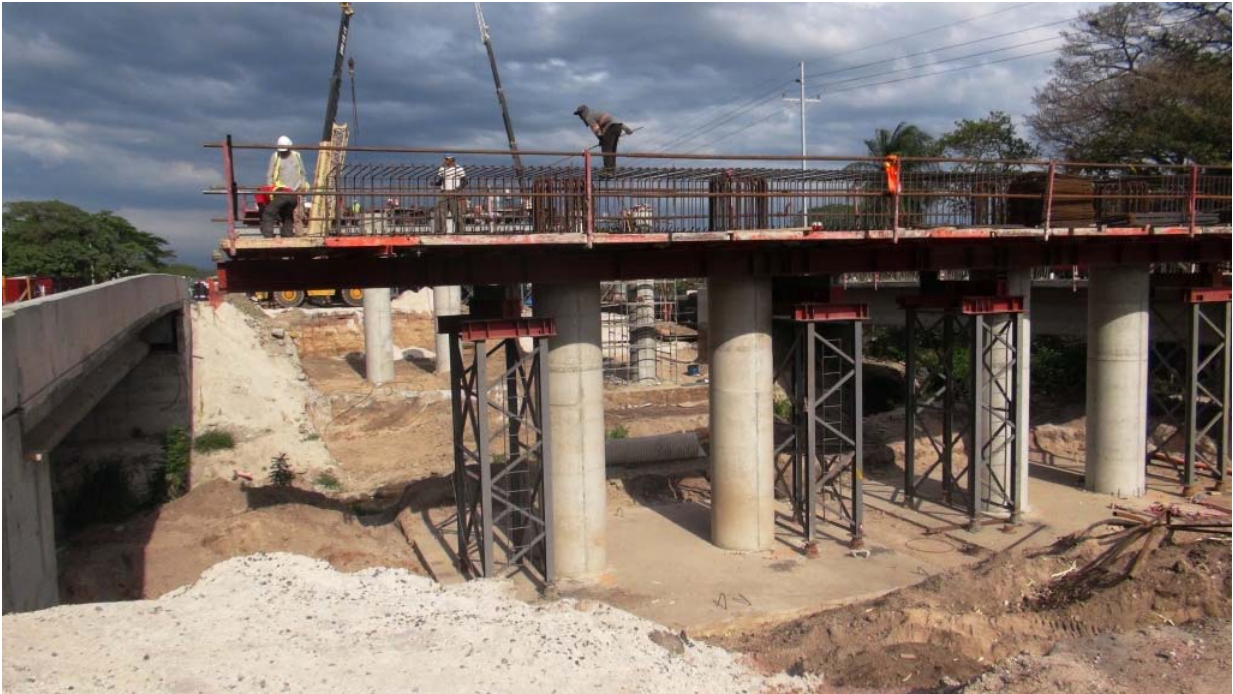
Figura 9: Intercambio Bagaces. Construcción de la viga cabezal del bastión Norte.