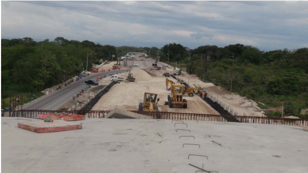
Figura 6: Intercambio Bagaces. Construcción del muro de contención anclado al suelo reforzado del acceso Sur.