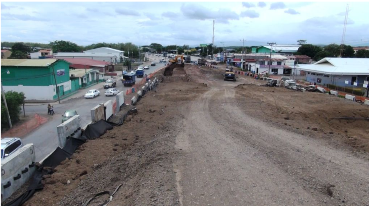
Figura 1: Intercambio Cañas. Trabajos en el acceso Norte