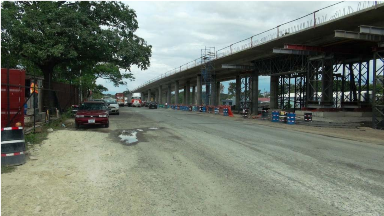
Figura 7: Intercambio Bagaces - Ya estaban construidas todas columnas y bastiones del puente.