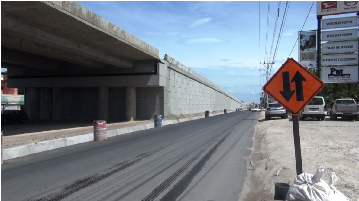
Figura 11: Avance en la construcción del acceso Norte.