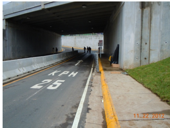
Fotografía 10. Peatones cruzando la calzada antes de ingresar al túnel.