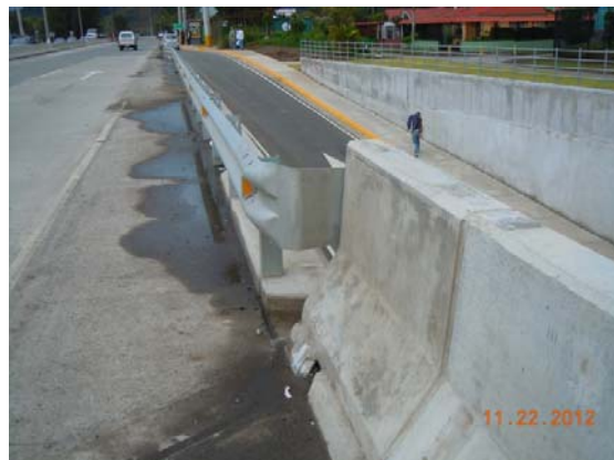
Fotografía 1. Conexión entre barreras de distinta rigidez, antes del túnel en sentido Cartago-San José