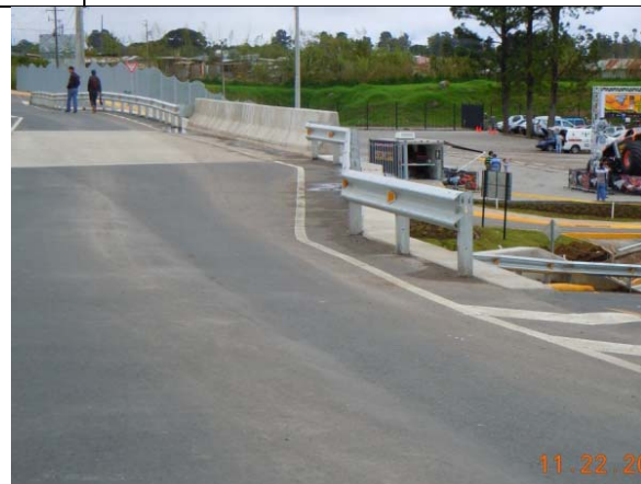
Fotografía 3 y Fotografía 4. Ausencia de terminal en barrera de acero. Acceso en sentido San José-Cartago.