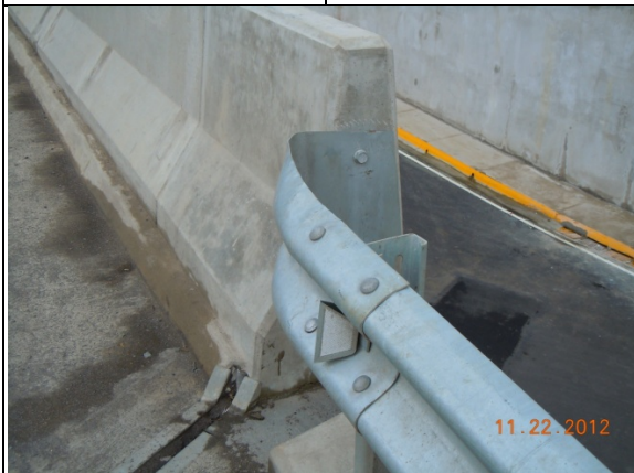
Fotografía 2. Conexión entre barreras de distinta rigidez, después del túnel en sentido Cartago-San José