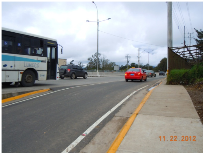
Fotografía 7 y Fotografía 8. Ausencia de demarcación de “Ceda el Paso” en la salida desde el centro comercial hacia el oeste.