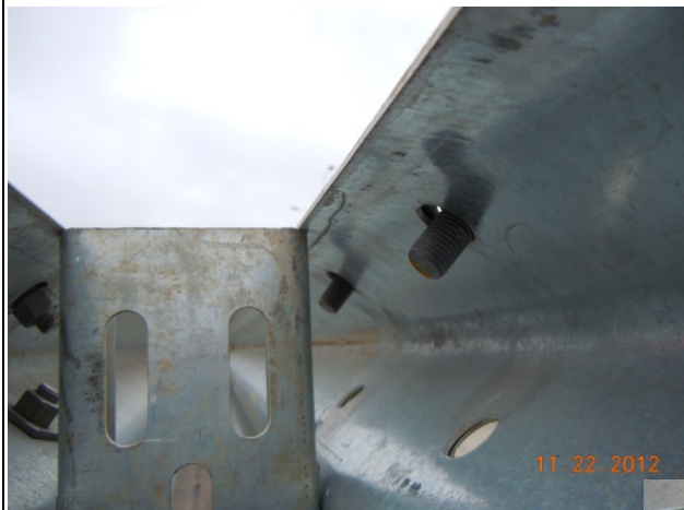
Fotografía 5. Ausencia de tornillo en la unión de dos vigas de la barrera.