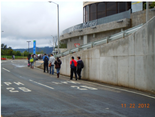
Fotografía 9. Peatones ingresan al centro comercial caminando por la calzada.