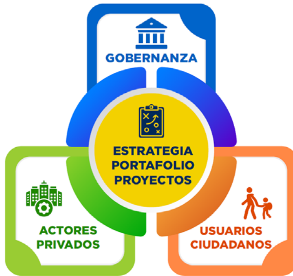
Ilustración 2. Ejes de discusión y análisis

También se identificaron algunos elementos para conformar una Hoja de Ruta a seguir para impulsar la implementación del modelo de APP en el país.