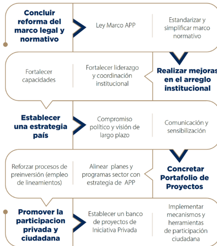
Figura 3. Aspectos prioritarios por considerar en la Hoja de Ruta

La construcción de una Hoja de Ruta efectiva es esencial para el impulso exitoso del modelo de Asociaciones Público-Privadas (APP). La figura 3 presenta una detallada enumeración de los aspectos identificados como prioritarios, proporcionando una guía clara y estructurada para la implementación y desarrollo continuo de las APP en nuestro contexto.