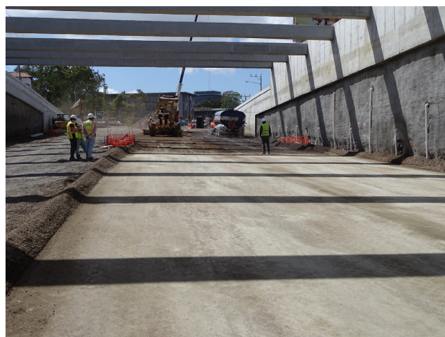
Figura 4. Acabado de bases estabilizadas con cemento en el proyecto “Construcción de un Paso a Desnivel en la Facultad de Derecho UCR - Rotonda de La Bandera, Ruta Nacional No. 39”.