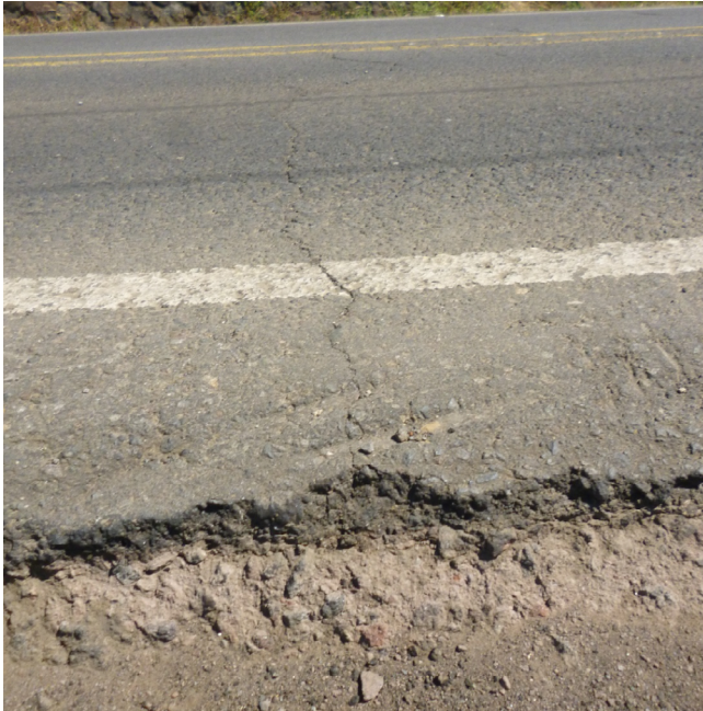
Figura 2. Reflejo de grieta de la base estabilizada en la capa asfáltica.