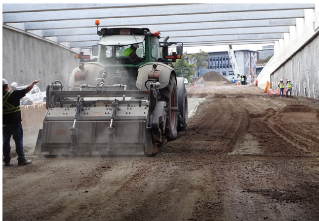
Figura 3. Proceso constructivo de bases estabilizadas con cemento en el proyecto “Construcción de un Paso a Desnivel en la Facultad de Derecho UCR - Rotonda de La Bandera, Ruta Nacional No. 39”.

En guías de diseño de referencias internacionales tales como la Portland Cement Association (PCA), específicamente en su publicación “ Guide to Cement-Treated Base (CTB) ” (PCA, 2006), las resistencias para bases estabilizadas con cemento aceptadas están en el rango de los 300 psi y los 550 psi, esto en unidades del Sistema Internacional equivale a aproximadamente 2,1 MPa y 5,5 MPa. Para el caso particular de Costa Rica, se cuenta con normativa nacional que regula la resistencia en bases estabilizadas, y al igual que la guía de la PCA, establece un límite máximo y límite mínimo de resistencia. Los límites establecidos en el CR-2010 en su actualización 2017 responden a las características mecánicas comprobadas en campo y a los materiales y procedimientos constructivos aceptados a nivel nacional.