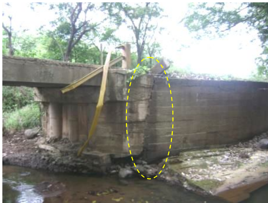
Figura 17. Juntas frías en aletones. Discontinuidad entre bastión y aletón.