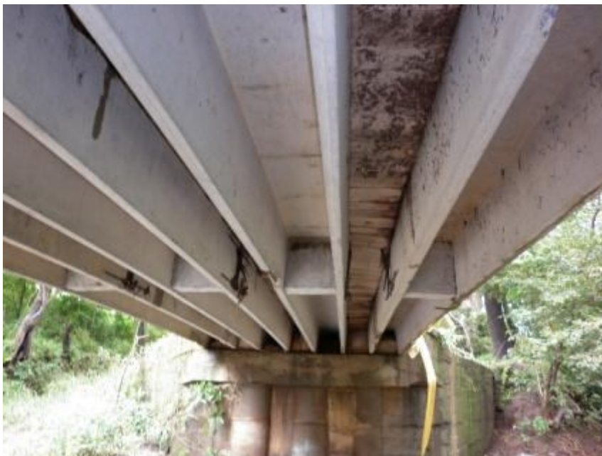
Figura 3. Vista inferior del puente Quebrada Grande.