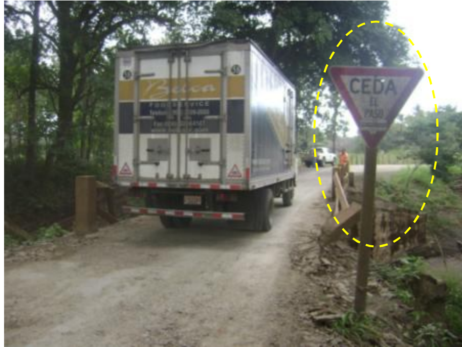
Figura 6. Señalización insuficiente y en mal estado.