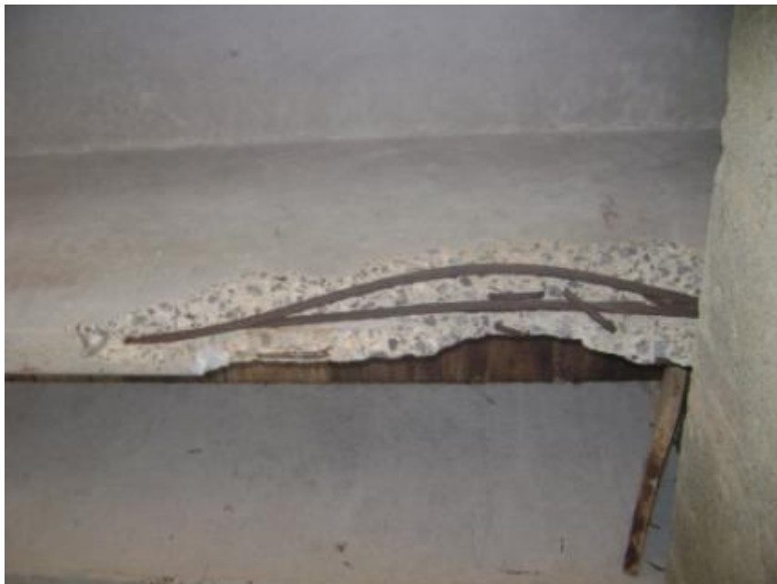
Figura 14. Cables de presfuerzo han perdido tensión por los daños.