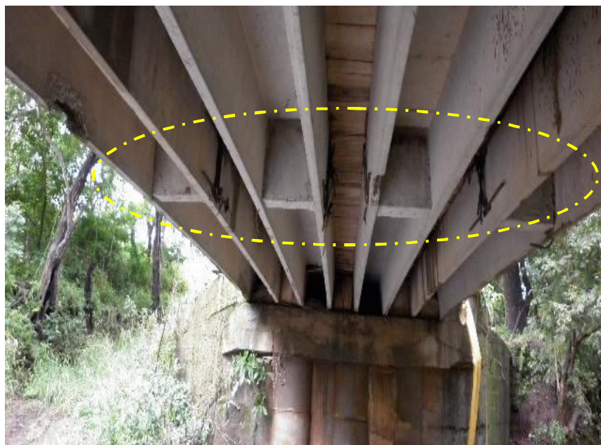
Figura 15. Viga diafragma no es continua, por lo tanto no cumple su función estructural.