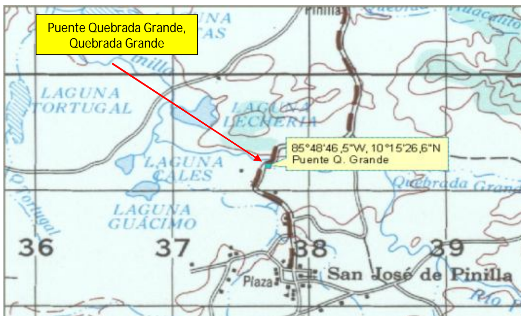
Figura 1. Ubicación del Puente Quebrada Grande – Quebrada Grande. Hoja Villareal Escala 1:50000.

El puente Quebrada Grande cruza la Quebrada Grande en el distrito Tamarindo, Cantón de Santa Cruz, Provincia de Guanacaste. Sus coordenadas de ubicación son 10^{\circ} 15' 26,6 de latitud Norte y 84^{\circ} 48' 46,5 de longitud Este. La Figura 1 muestra la ubicación geográfica del puente. La inspección visual se realizó los días 29 de Setiembre y 29 de Noviembre de 2010.