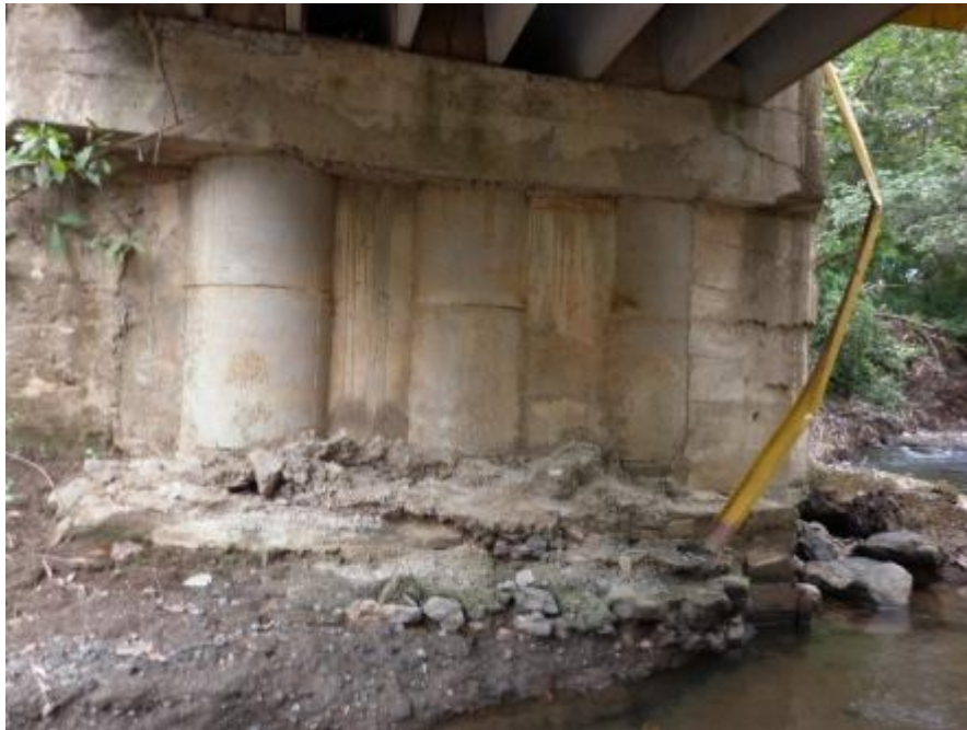
Figura 16. Configuración actual de los bastiones no es adecuada para este tipo de estructuras.