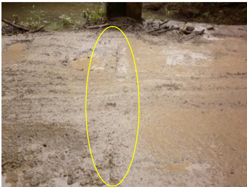
Figura 9. Las juntas de expansión se encuentran obstruidas por material proveniente del camino.