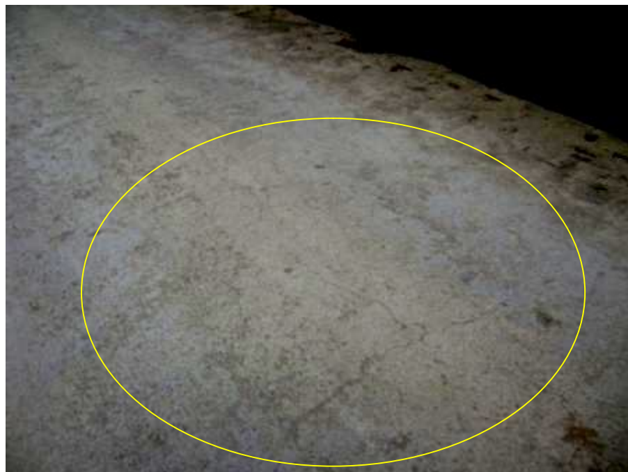
Figura 11. Agrietamientos en la losa del puente.