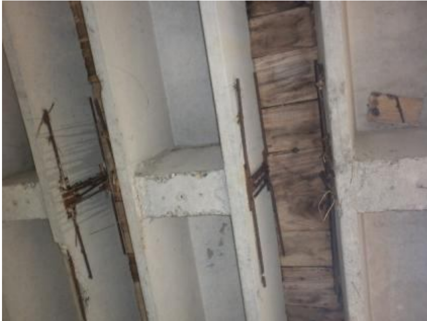
Figura 12. Formaleta dejada desde la colada de la losa impide realizar una inspección detallada.