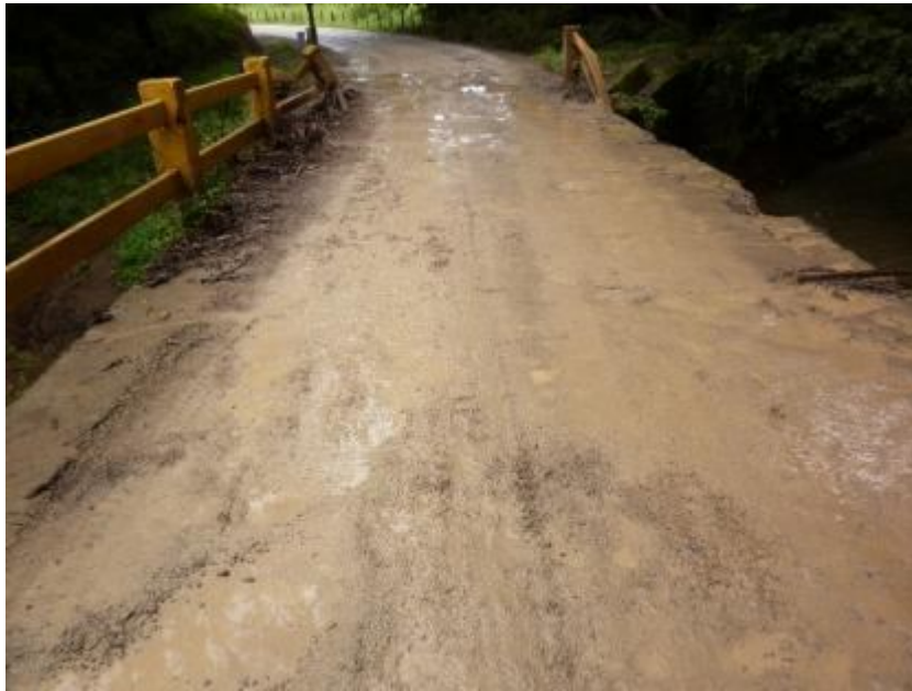
Figura 2. Vista a lo largo de la línea centro del puente Quebrada Grande, Quebrada Grande.