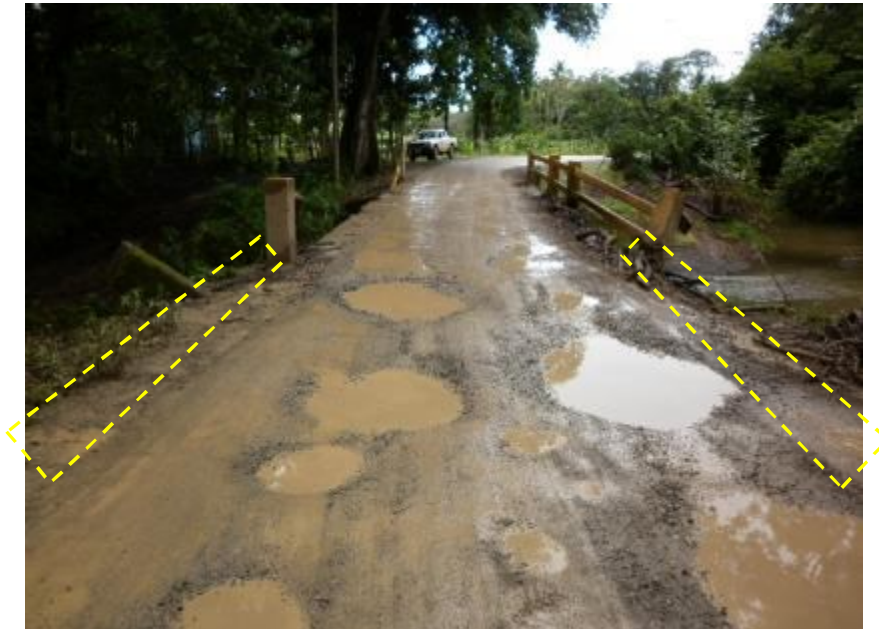
Figura 8. No hay sistemas de drenajes adecuados en los accesos