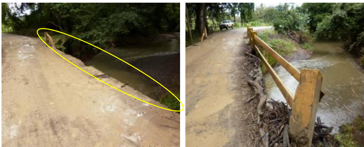
Figura 4. Ausencia y mal estado de las barandas del puente.