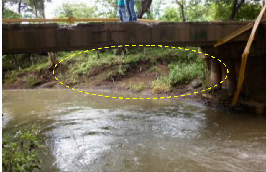
Figura 10. El río ha erosionado los taludes y podría dañar los rellenos de aproximación.