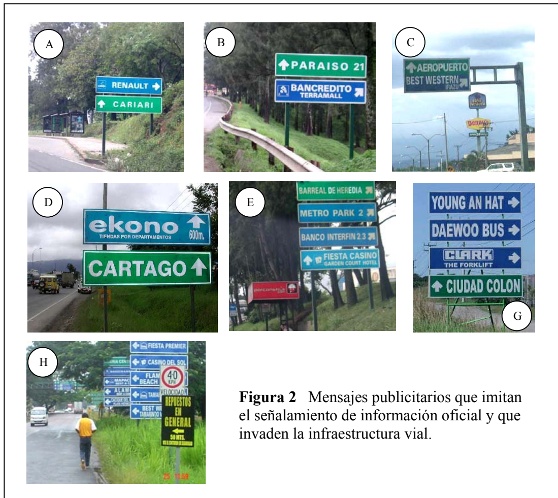
Figura 2 Mensajes publicitarios que imitan el señalamiento de información oficial y que invaden la infraestructura vial.

Estos letreros con fines publicitarios no sólo imitan por su diseño a los dispositivos