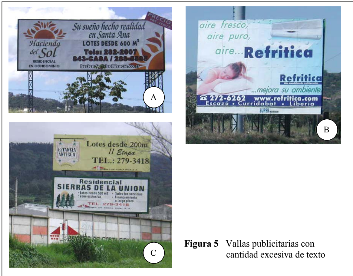
Figura 5 Vallas publicitarias con cantidad excesiva de texto

muestran algunos ejemplos de vallas publicitarias colocadas en las rutas nacionales que no cumplen con esta disposición.